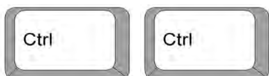
Ilustración 1. Teclas más empleadas.

Sin embargo, esta irrupción de las Tecnologías de la Información y Comunicación ha provocado o facilitado algunos cambios de actitudes en los alumnos que no pueden valorarse necesariamente en forma positiva. Es el caso del denominado “ciber-plagio académico”. Mediante el los alumnos adoptan y presentan en sus trabajos de investigación como ideas propias, teorías e hipótesis realizadas por otros investigadores, y es precisamente estas tecnologías asociadas a la Sociedad de la Información (SI), sobre todo Internet y más concretamente la WWW, las que facilitan esta práctica académicamente incorrecta y éticamente reprobable. Este fenómeno se ha extendido tanto entre los estudiantes que algunos autores hablan de la existencia de una “Generación Copiar-y-Pegar- (Comas, Sureda & Urbina, 2005). En la figura Ilustración 1 Teclas más empleadas se muestra las teclas más empleadas entre los estudiantes universitarios.