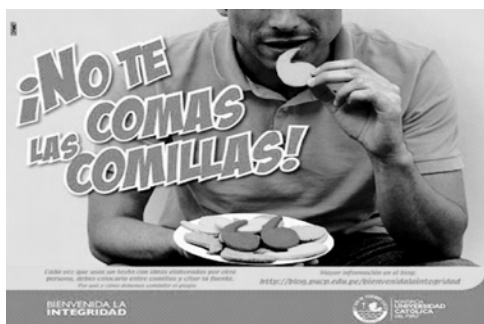
Ilustración 2. PUCP-Integridad

Una combinación de ambos modelos lo viene realizando la Pontificia Universidad Católica del Perú, la que en su página web ha incluido un link denominado “Bienvenida la Integridad” en la cual se muestran afiches como el que se muestra en la Ilustración 1 PUCP-Integridad.