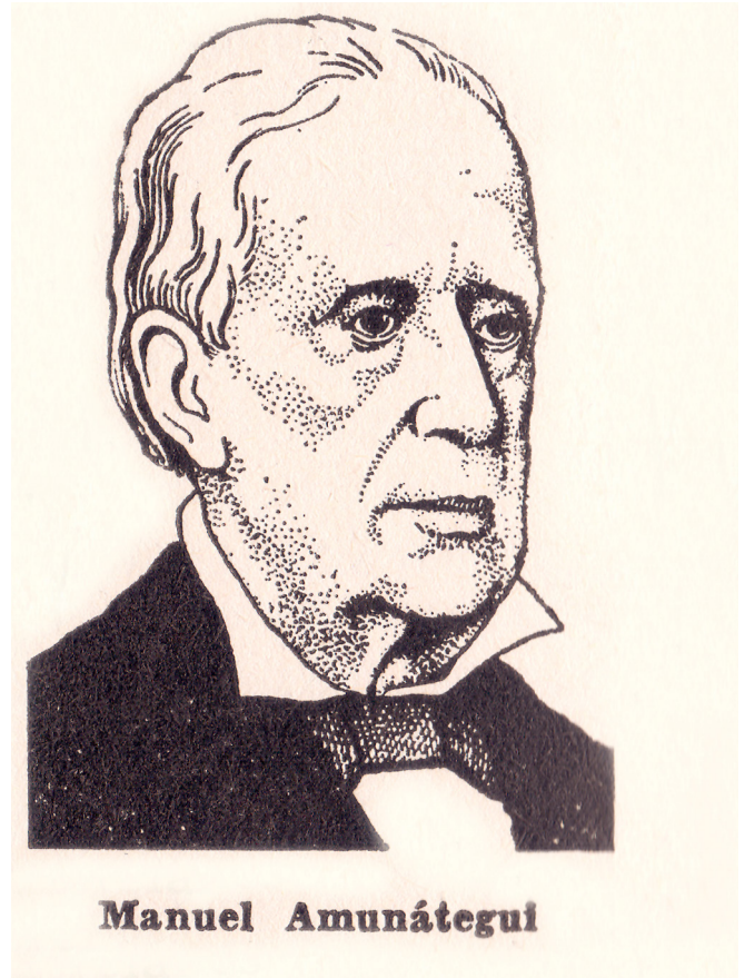
El Perú Ilustrado

En tal sentido, y en lo correspondiente a la extracción de datos, tras la búsqueda inicial de las fuentes se localizaron dieciséis mil setenta y seis (16.076) periódicos en soporte físico de 1839 hasta 1886, de