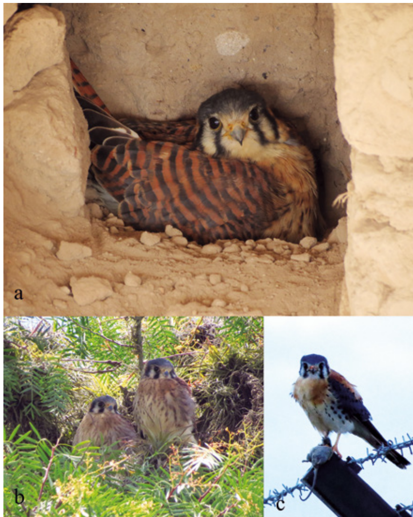
Figura 1. Individuos de Falco sparverius fotografiados en la localidad Tababela, donde fueron colectadas egagrópias: a) Hembra anidando en pared de casa abandonada, b) jóvenes perchados en vegetación adyacente a casa, c) macho adulto acabando de cazar un roedor Phyllotis haggardi .

Entre septiembre del 2013 y septiembre del 2015, colectamos egagrópias en dos localidades en la provincia de Pichincha (ubicadas en el piso Zoogeográfico Templado; Albuja et al. 2012) durante visitas esporádicas a dos localidades (Tabla 1): (1) casa antigua Caraburo, adyacente al Aeropuerto Internacional Mariscal Sucre en la parroquia Tababela (0°07'51.11"S, 78°21'6.31"W, 2371 m) allí predominan arbustos nativos como Acacia sp., Opuntia sp. y Croton sp., donde registramos a una familia de Falco sparverius (Fig. 1); y (2) Sangolquí, zona urbana ubicada al sureste de la ciudad de Quito (0°19'34.19"S,