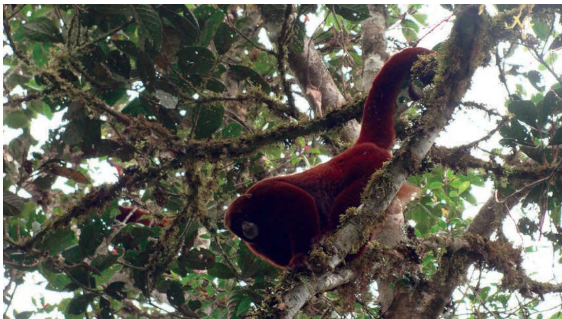
Figura 2. Macho adulto de Lagothrix flavicauda observado en Hoja Grande, San Martín.