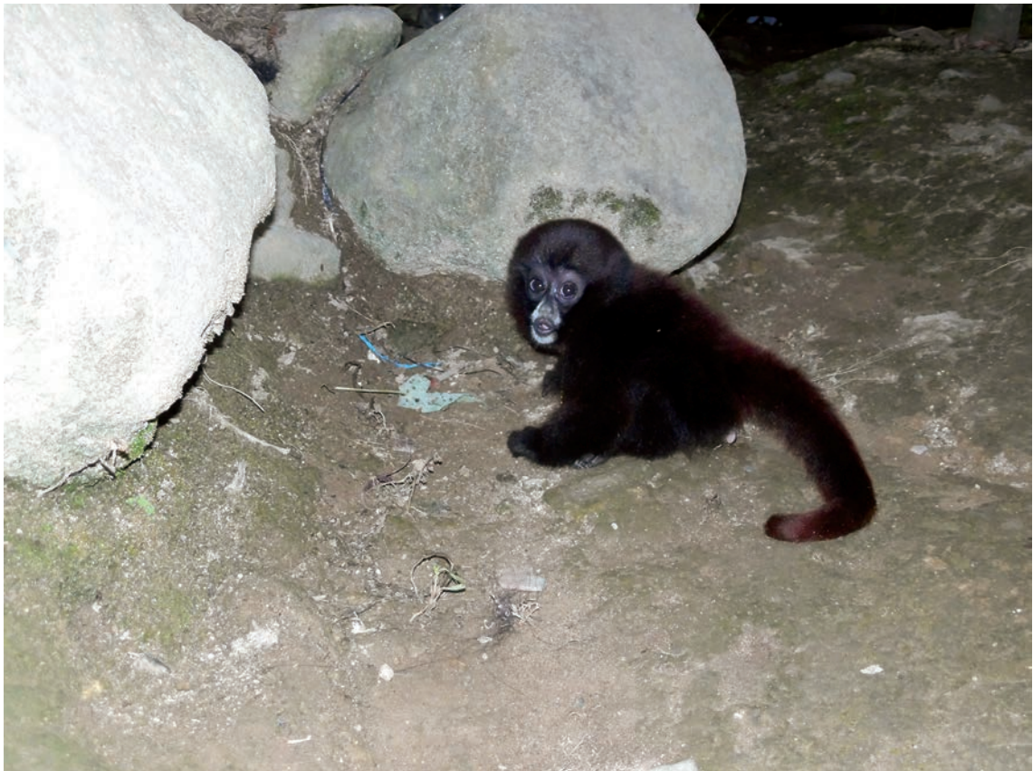
Figura 5. Infante de Lagothrix flavicauda destinado a la venta para mascota en Shunté, San Martín.