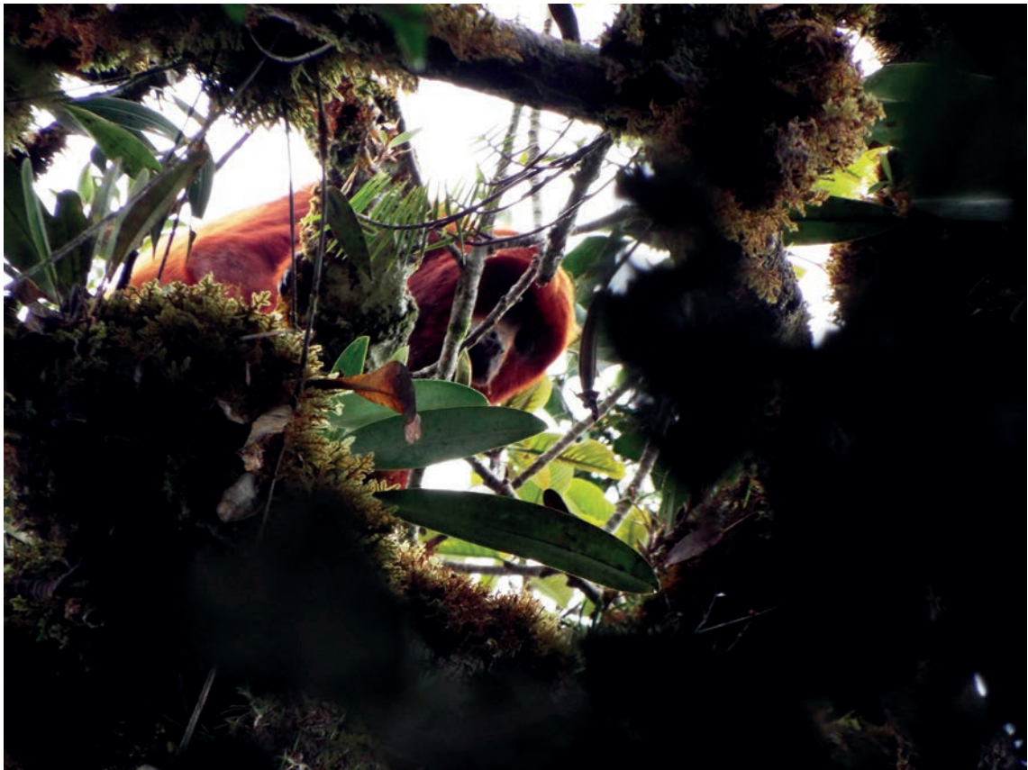
Figura 4. Ejemplar adulto de Aouatta seniculus observado en Chapákara, Región Huánuco.