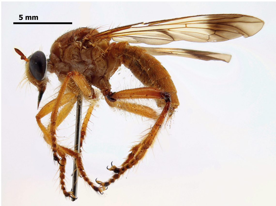
Figura 2. Smeryngolaphria maculipennis (Macquart, 1846), hembra, habitus, vista lateral.