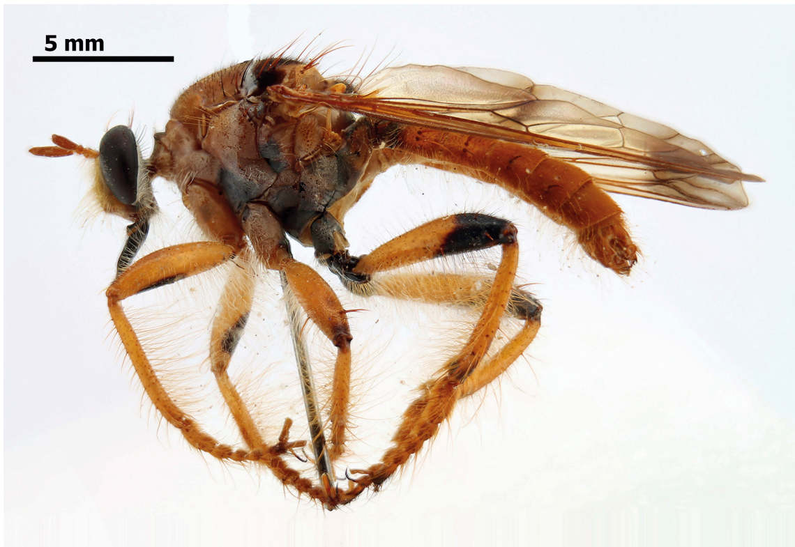
Figura 1. Smeryngolaphria gorayebi Artigas, Papavero & Pimentel, 1988, macho, habitus, vista lateral.