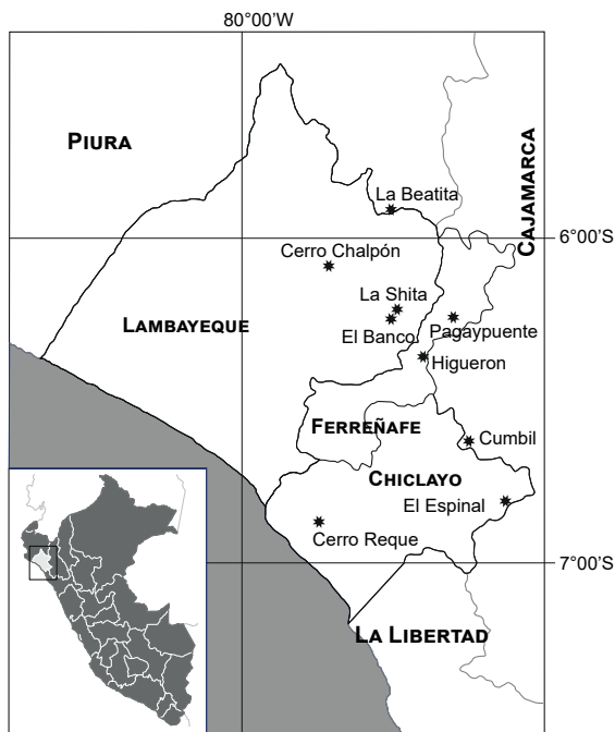
Figura 1. Mapa del departamento de Lambayeque mostrando las zonas de colecta de Tillandsia más frecuentes, citados en el presente estudio.

Se registraron 22 especies de Tillandsia L. pertenecientes a cinco subgéneros: Allardtia , es el mejor representado con 9 especies, una de ellas Tillandsia latifolia , con 4 variedades; el subgénero Anoplophytum , presenta una sola especie; Phytarrhiza , dos especies; Diaphoranthema , dos especies y el subgénero Tillandsia , 8 especies, de las cuales Tillandsia rauhii , presenta dos variedades, lo que hacen un total de 26 taxones (Figs. 2 y 3). De estos, 12 se registran por primera vez para el departamento de Lambayeque (Tabla 2), mientras que hasta el momento, 8 taxones se consideran endemismos del Perú (León et al. 2006 b).