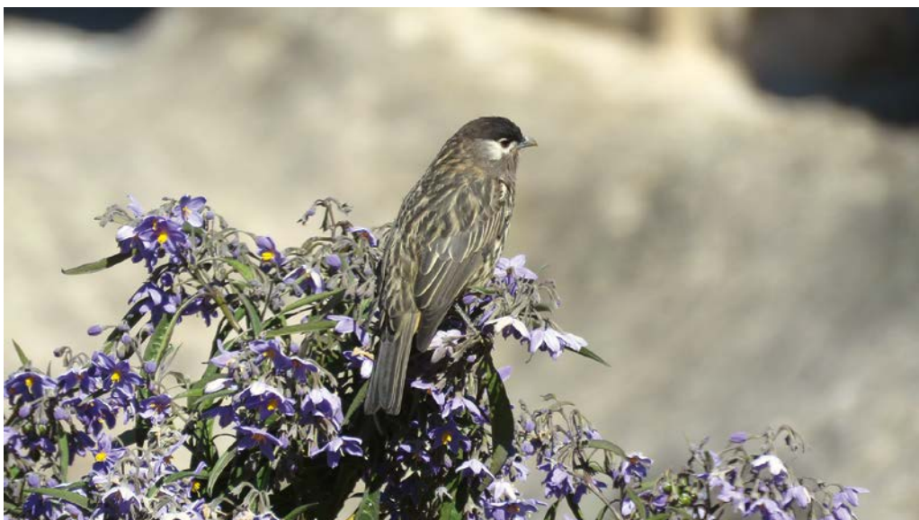
Figura 2. Individuo de Zaratornis stresemanni posado sobre arbusto de Solanum sp.