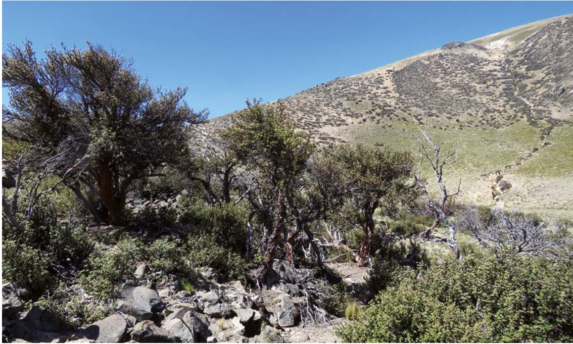
Figura 3. Parche de Polylepis sp. en el distrito de Tauría, Reserva Paisajística Sub Cuenca del Cotahuasi.

mente se registró la presencia de parches dispersos de Polylepis sp. a 8 kilómetros al suroeste del punto de observación, éstos estuvieron parasitados por plantas hemiparasitas (Loranthaceae) (Fig. 3).