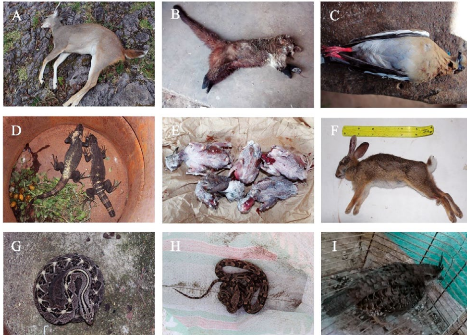
Figura 2. Ejemplos de fauna silvestre apropiada en Sierra de Huautla: A. venado cola blanca ( Odocoileus virginianus ), B. tejón ( Nasua narica ), C. huilota o paloma de alas blancas ( Zenaida asiática ), D. iguana ( Ctenosaura pectinata ), E. tórtolas ( Columbina inca ), F. conejo de campo ( Sylvilagus cunicularius ), G. víbora de cascabel ( Crotalus culminatus ), H. mazacuate ( Boa constrictor ), I. codorniz ( Philortyx fasciatus ). Fotos obtenidas en trabajo de campo.

más, es relevante por su aprovechamiento integral donde se obtiene productos medicinales, materias primas para herramientas y ornamentos (Estrada-Portillo et al. 2018), similar a lo registrado en este trabajo donde se reporta el aprovechamiento de astas, grasa, sangre, piel, cabezas o patas para diversos fines similares.