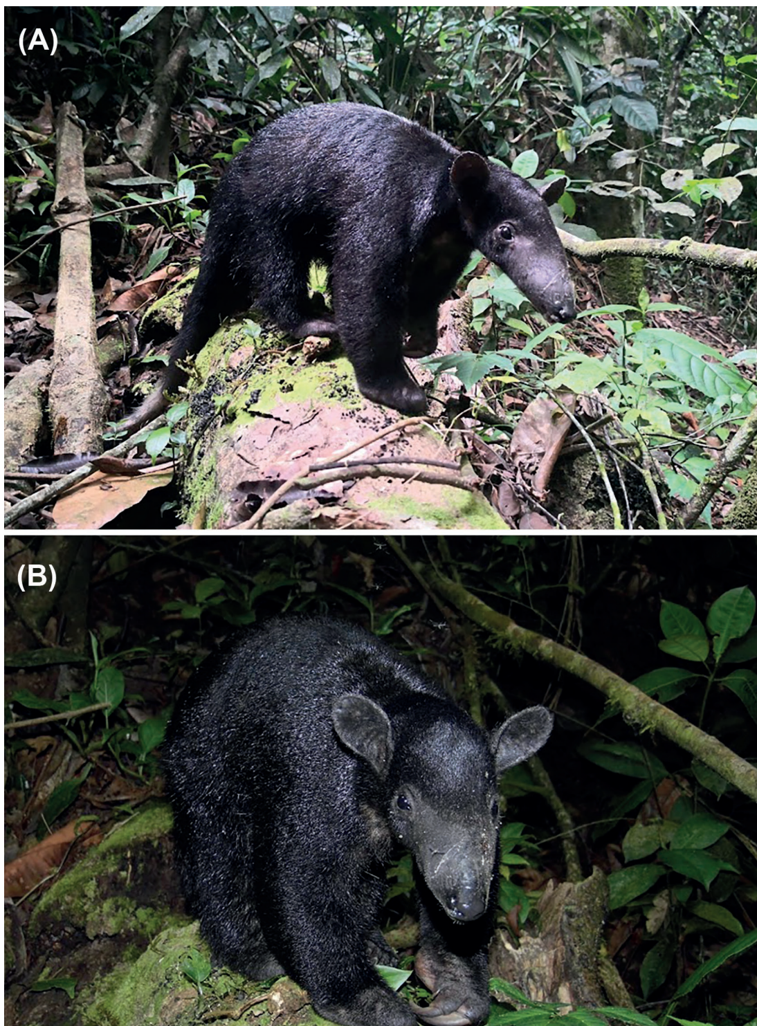
Figura 2. (A) y (B) Individuo melánico de Tamandua tetradactyla observado el 18 de Julio de 2018, en el departamento de Huánuco.

El fenotipo de este individuo corresponde a un melanismo parcial, ya que su pelaje era negro en todo el cuerpo (Fig. 2A), excepto en la última parte de la cola, la cual presentaba coloración amarillenta. El individuo fue observado mientras descansaba y buscaba alimento en un tronco caído (Figura 2B).