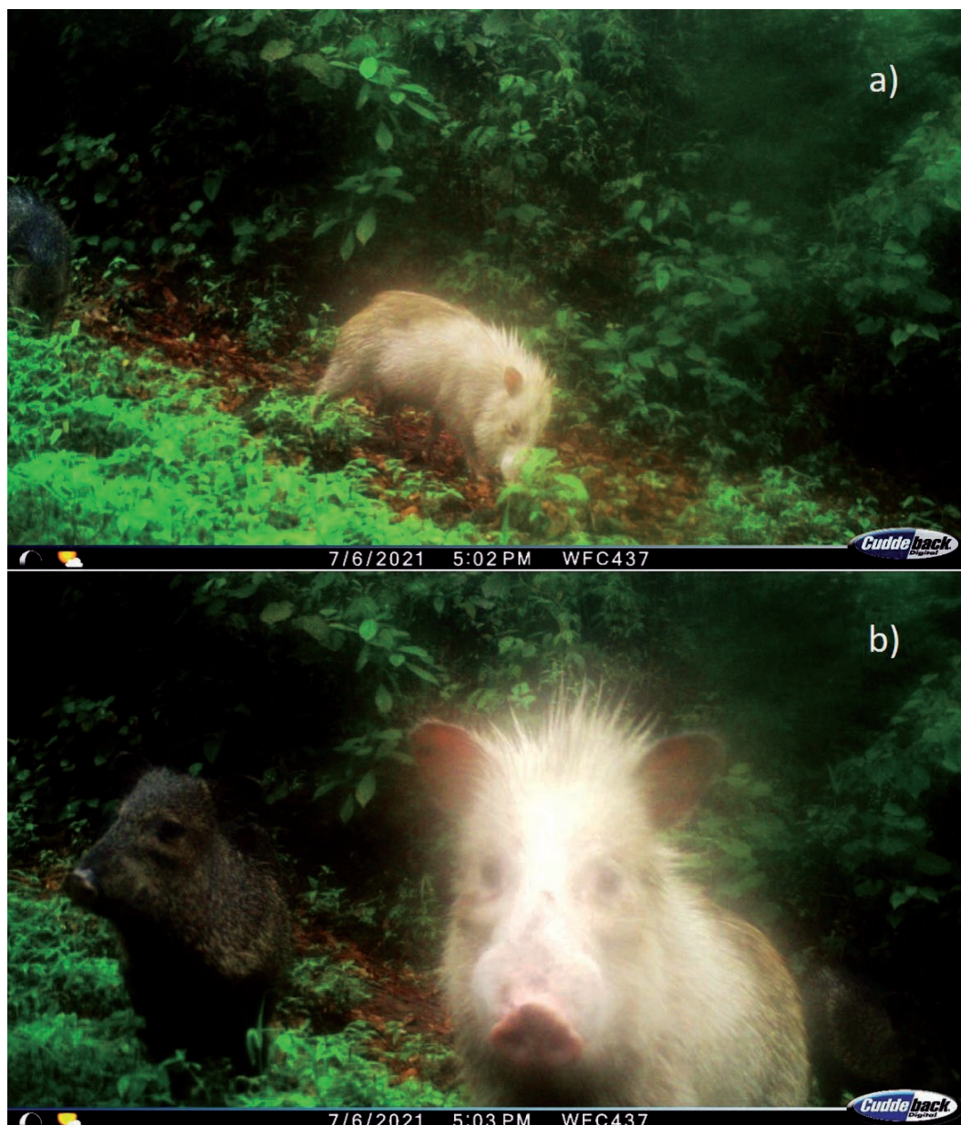
Figura 3. (A) y (B). Individuo de Pecari tajacu con leucismo acompañado de otros individuos adultos con coloración típica.

El registro de P. tajacu con leucismo en vida libre constituye el primer reporte para México, y a nivel continental corresponde al tercer registro. En Brasil ha habido reportes de dos casos de albinismo (Veiga 1994) y uno de leucismo (da Silva et al. 2019). Mientras que, en cautiverio se cuenta con el registro de un grupo de 10 ejemplares que formaban parte de la colección del zoológico Miguel Álvarez del Toro (ZooMAT) en el estado de Chiapas, México, donde esta anomalía fue atribuida a la consanguinidad generada por varios años de entrecruzas en la piara (Torres 2010).