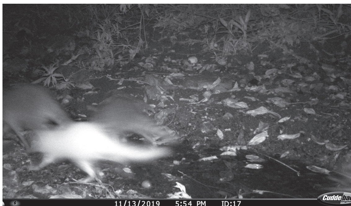
Figura 2. Individuo de Procyon lotor con coloración atípica, acompañado de dos ejemplares con la coloración característica de la especie.

Las anomalías cromáticas se encuentran presentes en todos los grupos de vertebrados, habiendo pocos registros en peces (Kimball 1990), y siendo común en las aves (Thompson et al. 2000; Davis 2007; Nolazco 2010); y recientemente, ha sido frecuente el reporte de estas anomalías en especies de mamíferos, principalmente de talla mediana o grande (Brito & Valdivieso-Bermeo 2016; Mejía 2019; Romero-Briceño & González-Carcacia 2020; Rivero-Castro et al. 2020).