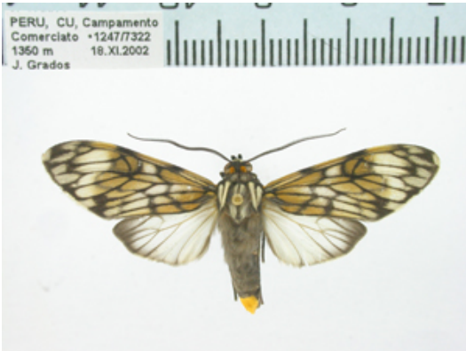
Figura 1 . Theages griseatum Walker, macho

paró láminas con bálsamo de Cánada. Los dibujos se realizaron con cámara lúcida.