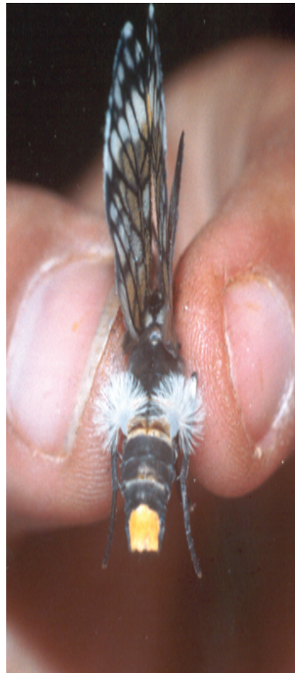
Figura 2 . Penachos de pelos dorsales de Theages griseatum Walker, en espécimen vivo.

Al realizar la preparación y el retiro de las escamas de los terga abdominales de especímenes machos de Theages griseatum (Rothschild), se observa que en las áreas ánterolaterales de los segmentos IV, V, VI y VII, hay un conjunto de cerdas, que se disponen con dirección hacia el margen mesal, en una invaginación del margen anterior del mismo segmento y que están cubiertos por el segmento abdominal anterior (Fig. 3). La disposición telescópica de los segmentos, hace que