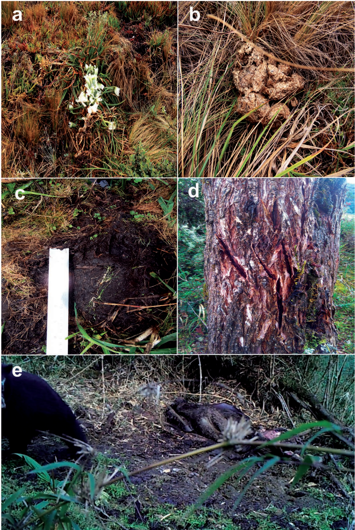
Figura 2. Registros de presencia del oso andino: a) comedero de puya encontrado en el cerro Tranca, comunidad de San Martín de Chupón, b) excretas encontradas en el cerro Runawanay, comunidad de San Martín de Chupón, c) huella de oso y d) marcas en los árboles (rasguños) encontrados ambos en Huayllachayoc, comunidad Huecchues, y e) fotografía de un oso andino en la comunidad de San Martín de Chupón.