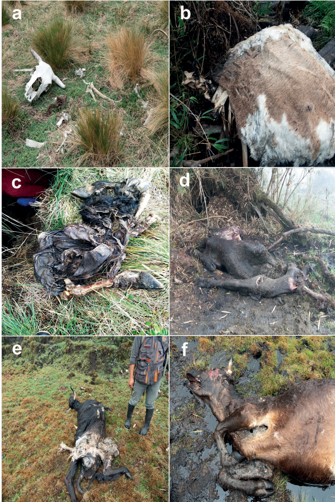
Figura 4. Cadáveres encontrados en San Martín de Chupón: a) restos de huesos encontrados en la puna cerca de parches de matorral arbustivo, b) restos de hueso y piel ubicados en el matorral arbustivo, c) restos de hueso y piel debajo de cueva de rocas en la puna, d) cadáver descompuesto con extremidades posteriores separadas, e) y f) cadáveres ligeramente descompuestos y casi completos sin marcas de ataques por algún depredador.