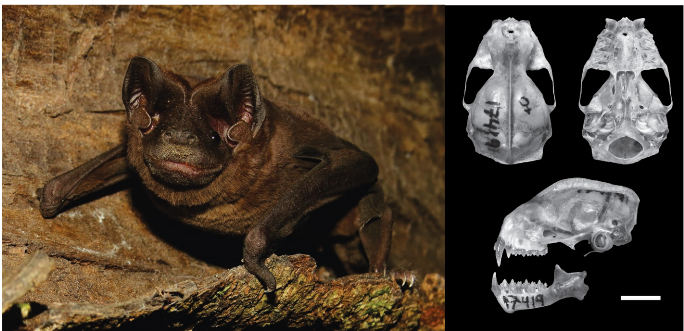
Figura 2. Vistas dorsal, ventral y lateral del cráneo, y vista lateral de la mandíbula, de Molossus bondae (MUSA 17419) de Perú. Escala del cráneo = 5 mm.

Comentarios. Gregorin y Chiquito (2010) estudiaron las variaciones inter- e intraespecíficas del género Promops , reconociendo tres especies: P. centralis , con una población habitando en Centro América y dos en el Neotropico; P. davisoni , restringido a la vertiente occidental de los Andes de Ecuador y Perú; y P. nasutus con tres poblaciones habitando en el Neotropico. Por su parte,