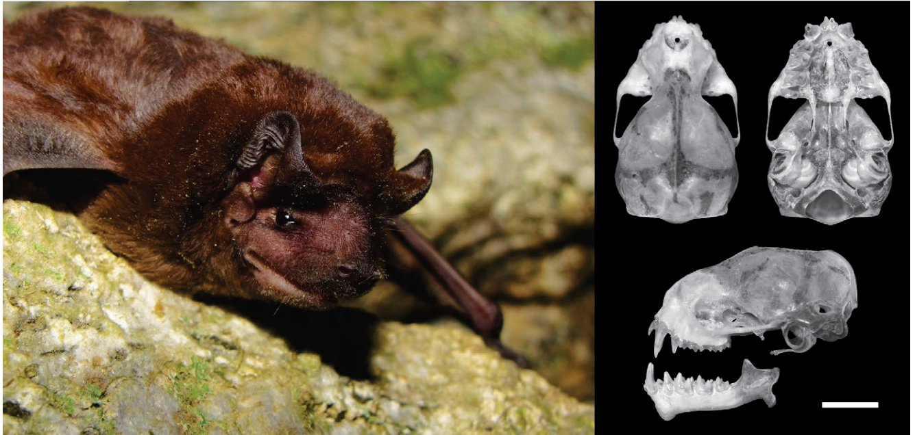
Figura 3. Vistas dorsal, ventral y lateral del cráneo, y vista lateral de la mandíbula de Promops nasutus (MUSA 15838) de Perú. Escala = 5 mm.

con 192 especies, ubicándolo por debajo de Indonesia (239 spp., Maryanto et al. 2019) y Colombia (217 spp., Ramírez-Chaves et al. 2021), y por encima de Brasil (182 spp., Marquez-Quintela et al. 2020), Ecuador (178 spp., Tirira et al. 2022), Venezuela (165 spp., Sánchez & Lew 2012), México (144 spp., Sanchez-Cordero et al. 2014) y Bolivia (138 spp., Aguirre et al. 2019).