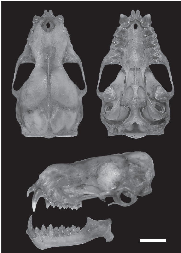
Figura 1. Vistas dorsal, ventral y lateral del cráneo, y vista lateral de la mandíbula, de Eumops glaucinus (MUSA 16331) de Perú. Escala del cráneo= 5 mm.

Descripción. El espécimen MUSA 16331 es asignado a la especie Eumops glaucinus por la siguiente combinación de caracteres diagnósticos: cola sobrepasa el borde del uropatagio, con una porción libre notoria; coloración dorsal marrón canela; orejas grandes (> 24 mm), anchas y expandidas lateralmente, unidas en la frente y con una quilla interna muy marcada; antebrazo menor a 65 mm, pero mayor a 55 mm; trago desarrollado de forma más o menos cuadrada; labio superior sin pliegues o surcos; y fosetas basiesfeniideas superficiales, pero bien desarrolladas (Fig. 1).