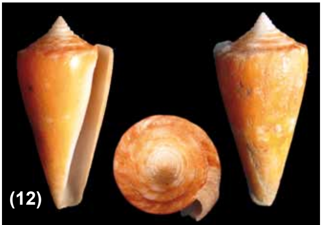
Figuras 9 – 13. (9) Conus (Ximeniconus) perplexus ; (10) Conus (Ximeniconus) tornatus ; (11) Conus (Ximeniconus) ximenes ; (12) Conus kohni ; (13) Conus xanthicus .

Hábitat: Sublitoral arenoso. Entre 61 y 109 m de profundidad (Hendrickx & Toledano 1994).