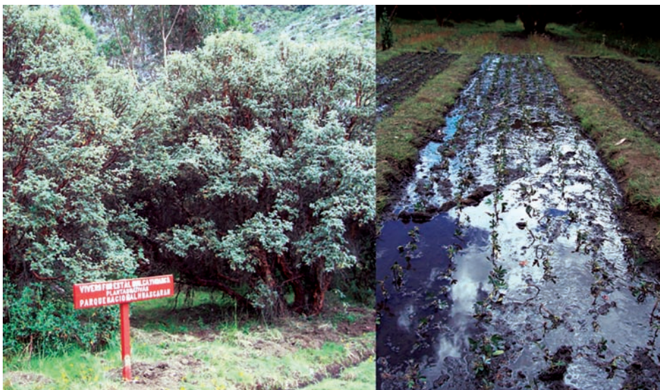
Figura 4. (A) Vivero forestal en la región de El Quilcayhuanca, Parque Nacional Huascarán, donde P. sericea y P. weberbaueri se cultivan para regenerar otros bosques de la región. (B) Parcelas de Polylepis plántulas.