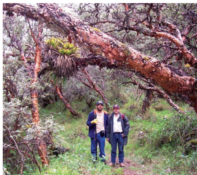
Figura 1. Mezcla de bosques de Polylepis en el Parque Nacional Huascarán, Cordillera Blanca del Perú, que soporta una variedad de epifitas y es importante para la intercepción de neblina.

Todas las especies de Polylepis son arbustos o árboles, algunos hasta 10 m de altura y comparten características morfológicas, que incluyen troncos rojos y torcidos, corteza delgada y exfoliante, y pequeñas hojas imparipinnadas. Varias especies son