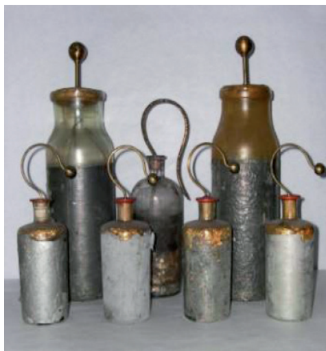
Botellas de Leyden Máquina de Randsen.