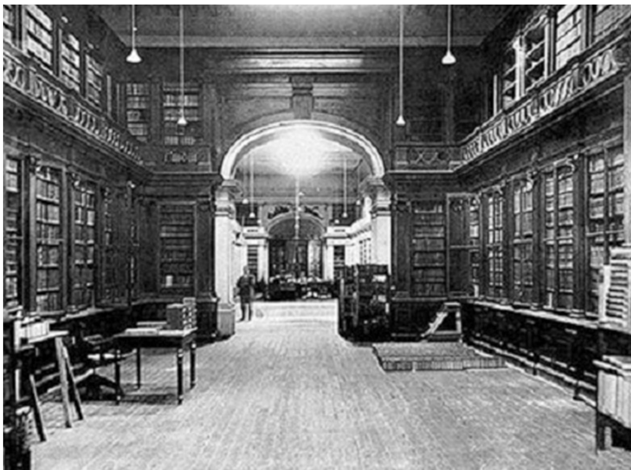
Foto de una de las majestuosas salas de la Biblioteca Nacional antes de la ocupación chilena.

contaba con tres salas de lectura y 29530 volúmenes, los cuales fueron aumentados a 56127 en 1880 (Valderrama, 1971).