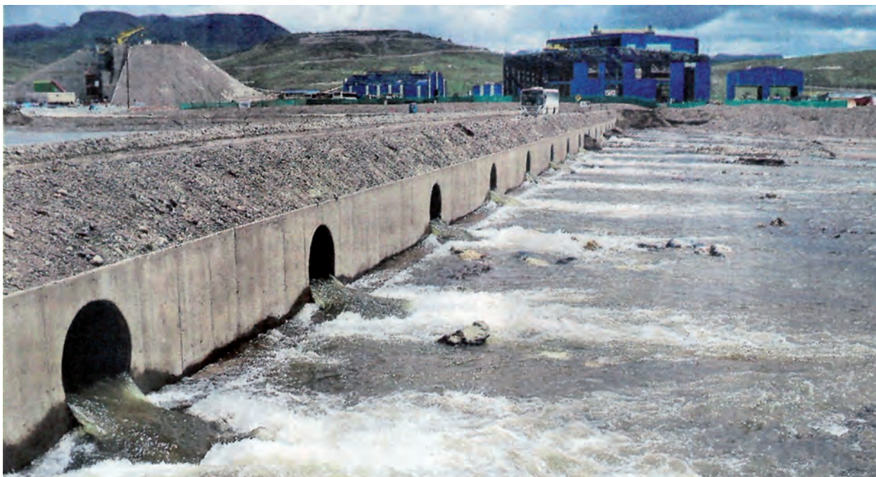
DESPERDICIOS. Los residuos sólidos de la empresa se descargan en los afluentes de los principales ríos de la provincia.