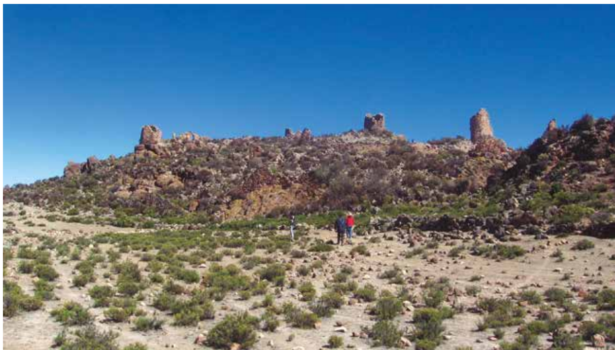
Figura 2: Vista panorámica del sitio arqueológico de Wiraqucha Perqa, Chocorvo Arma, Huaytará.

sobre afloramientos rocosos, sobre las que se dispone el basamento. En una de ellas (Chulpa 1), ubicada al extremo occidental del sector, se registró que tiene 4.84 metros de altura. Tiene un nivel subterráneo, cuyo acceso es por un vano cuadrangular ubicado en el paramento norte, el cual comunica el exterior con una cámara interna de forma elíptica de 3.47 metros de largo por 1.20 metros de ancho y 1.84 metros de alto. El vano es de 0.40 metros de ancho por 0.32 metros de alto y 0.41 metros de grosor. En el interior de esta cámara subterránea se halló sobre la superficie del lado Norte un afloramiento rocoso. Las piedras utilizadas en la construcción son de forma adoquinada, tipo aladrillado (alargado), dispuestas en el muro con su eje mayor en el ancho del muro, y con pachillas medianas entre estas para rellenar los espacios vacíos. La cubierta de la cámara es en falsa bóveda, con piedras voladizas que sostienen piedras alajadas. El segundo nivel está conformado por una cámara de forma elíptica, de 4.30 metros de largo por 1.60 metros de ancho, al cual se accede por un vano de forma ligeramente trapezoidal de 1.10 metros de alto por 0.54 metros de ancho en el lado superior y 0.63 metros en la parte inferior, vano dispuesto encima del vano de acceso a la cámara inferior.