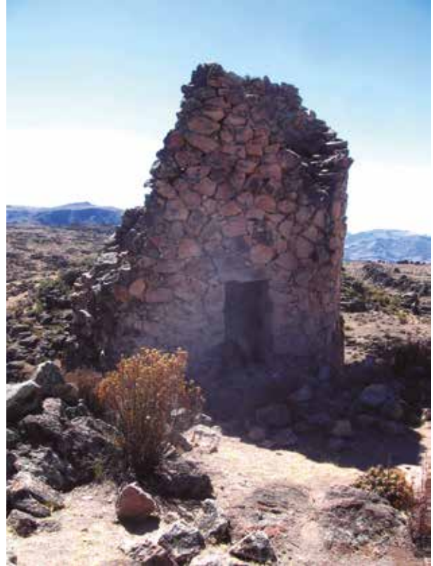
Figura 3 (izquierda): Vista de una chullpa elevada del sector B del sitio arqueológico de Wiraqocha Perqa. Figura 4 (Derecha): Vista de otra chullpa, sector B, Wiraqocha Perqa.