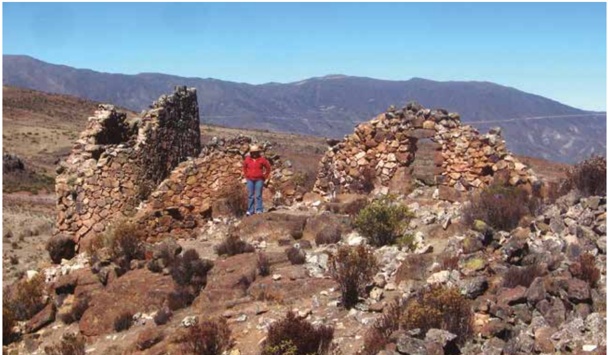
Figura 5: Vista panorámica de algunas edificaciones del sector B del sitio arqueológico de Wiraqocha Perqa.