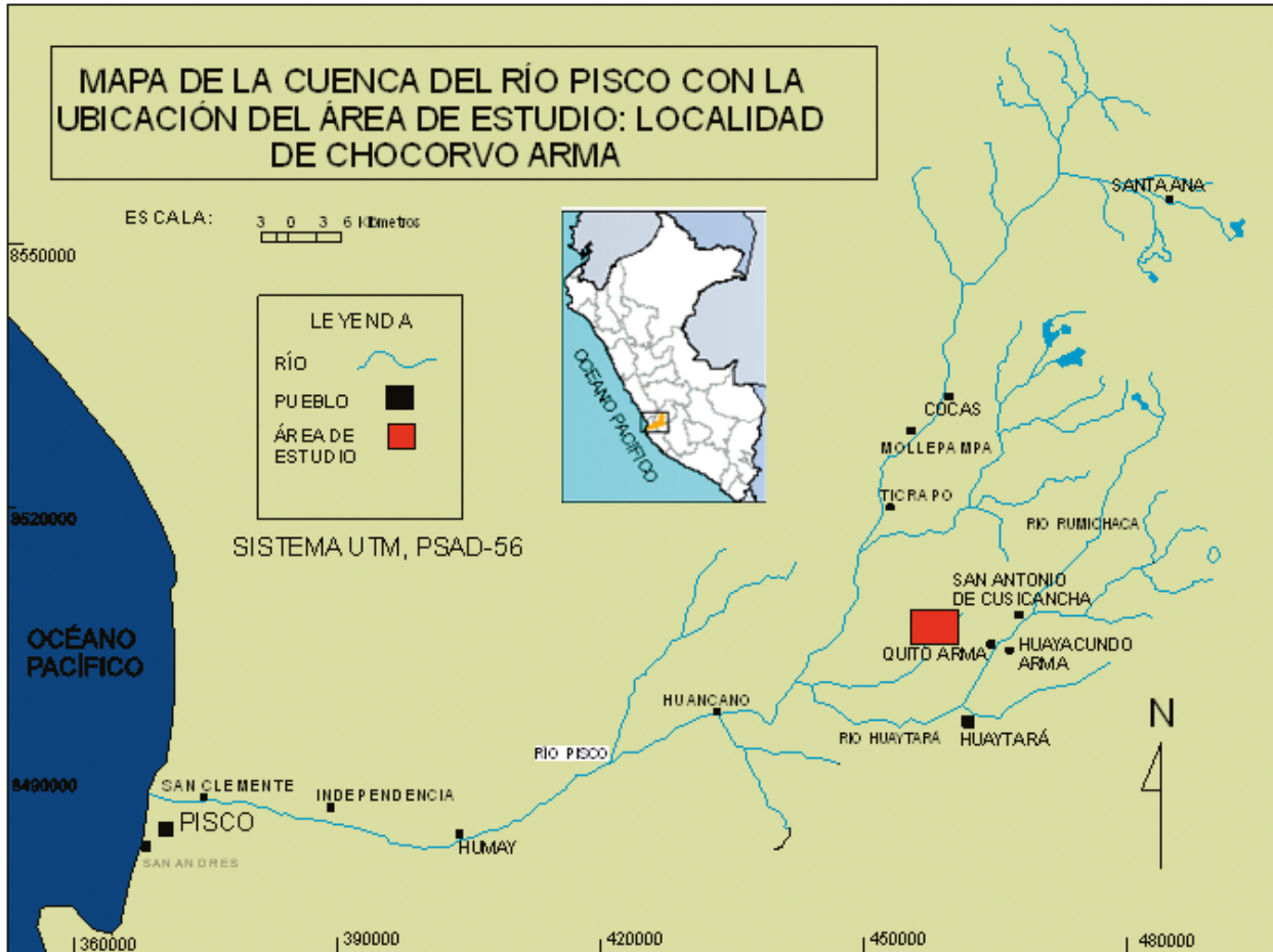
Figura 1: Mapa de la cuenca del río Pisco, con la ubicación del área de estudio: la localidad de Chocorvo Arma.