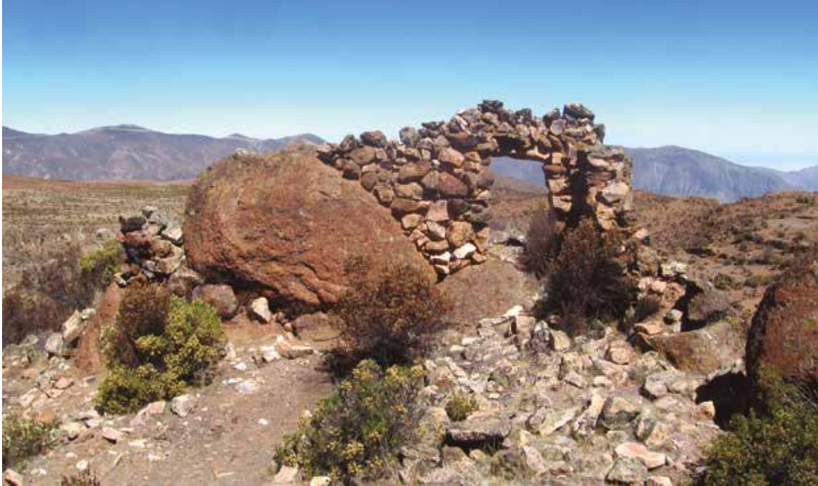
Figura 6: Vista del vano de acceso a un recinto rectangular del sector B del sitio arqueológico de Wiraqocha Perqa.