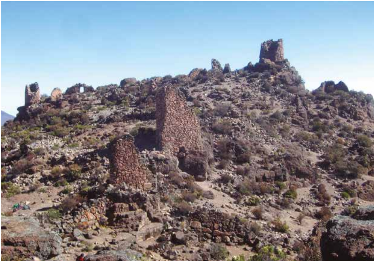
Figura 7: Vista panorámica de la distribución de edificaciones en el sector B, Wiraqocha Perqa.