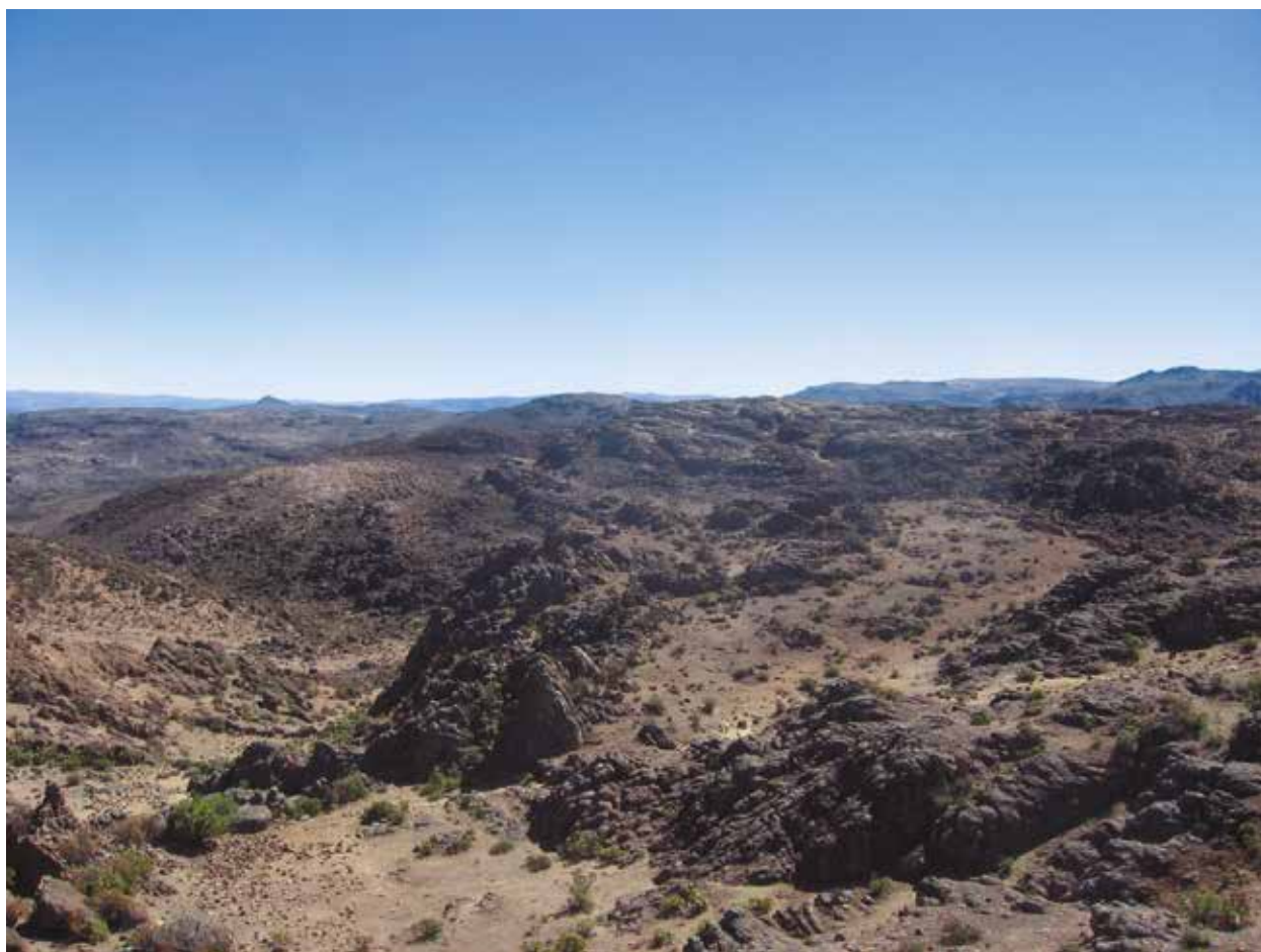
Figura 1: Vista panorámica del territorio alto de Chocorvo Arma, Huaytará.

los Chukurpus, entidad socio política que fue luego conquistada y anexada al Tawantinsuyu. Lamentablemente la arqueología no ha podido hasta la fecha tener una detallada definición de esta sociedad. Sin embargo, por información oral se conoce que su población se dedicaba a la agricultura en las partes bajas y a la ganadería en las partes altas. Duccio Bonavía (1996: 293, 327) haciendo referencia a la obra de Vásquez de Espinoza señala que esta provincia en los primeros años de la colonia se caracterizaba por presentar grandes cantidades de camélidos que la población de Ica utilizaban para sus cargas comerciales. El territorio Chukurpu se caracteriza por presentar asentamientos en las partes altas de los cerros (distantes de los ríos) con complejos sistemas de andenerías que se elevan desde el cauce mismo de los ríos hasta los contrafuertes más elevados. Bueno (2003: 43) analiza como los topónimos castellanizados Cho-