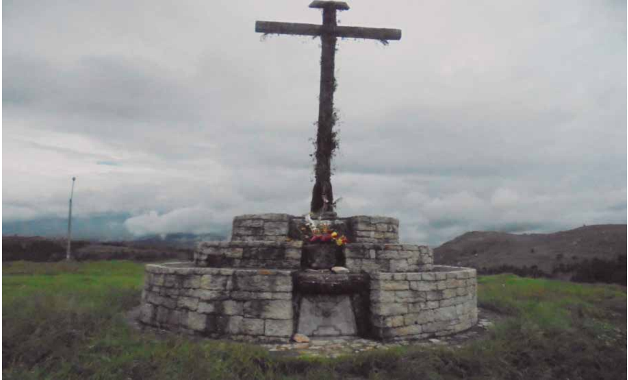
Fig. 11: Santuario y Mirador de Lamud Urco