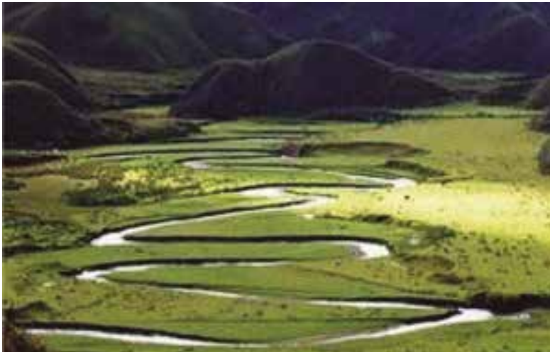
Fig. 4: El Valle Huaylla Belén