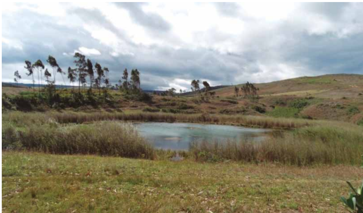
Fig. 6: La laguna de Chimal

te escurrimiento superficial y subterráneo transfiere el agua al valle de Lamud para ser utilizada en la actividad agrícola y el consumo humano.