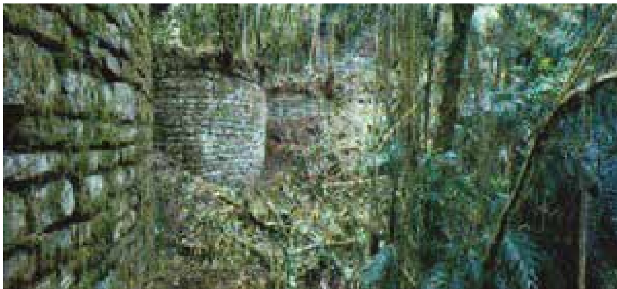
Fig. 9: Vista del Gran Vilaya