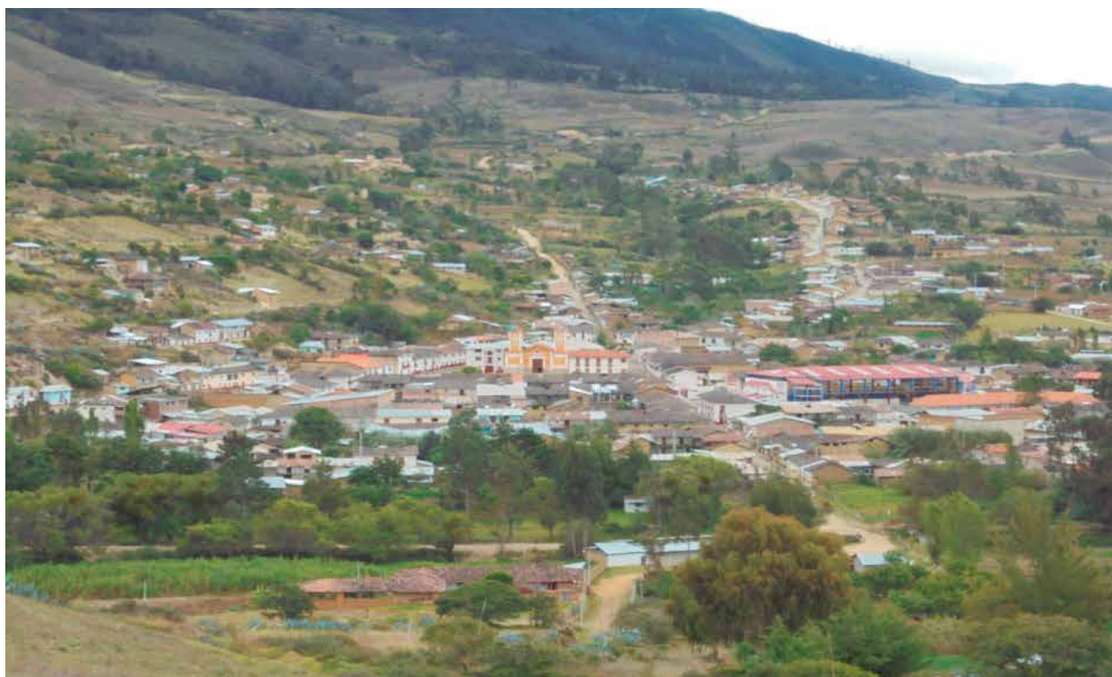
Fig. 13: Ciudad de Lamud capital de la provincia de Luya

Festividad Patronal de la Virgen de las Nieves. Se celebra el mes de agosto en el pueblo de Paclas.