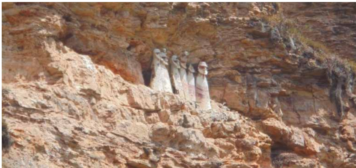
Fig. 8: Los Sarcófagos de Karajía

más de 50 estructuras funerarias entre mausoleos y sarcófagos construidos en fila. En un primer momento las estructuras semicirculares sirvieron como viviendas y lugares de refugio, probablemente a causa de enfrentamientos continuos entre los subgrupos enemistados.