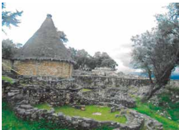
Fig. 7: Una de las construcciones al interior de la Fortaleza de Kuélap

El acceso a la fortaleza es de tres horas en transporte vial desde Chachapoyas o desde Lamud; se prevé en los próximos años la construcción de un sistema de telecabinas de acceso hacia la Fortaleza de Kuélap lo cual reduciría el acceso a 15 minutos desde el pueblo de Tingo a la fortaleza, esto significaría un ahorro de tiempo para los visitantes. En ese contexto queda pendiente evaluar el impacto que pueda generar la construcción y uso de este proyecto en el sitio arqueológico y en el conjunto de recursos naturales que circundan la ciudadela.