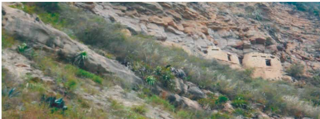
Fig. 10: Sitio arqueológico de Ayachaqui

hasta el sitio. La administración está a cargo de la municipalidad provincial; cabe mencionar que se requiere medidas urgentes para su conservación y protección.