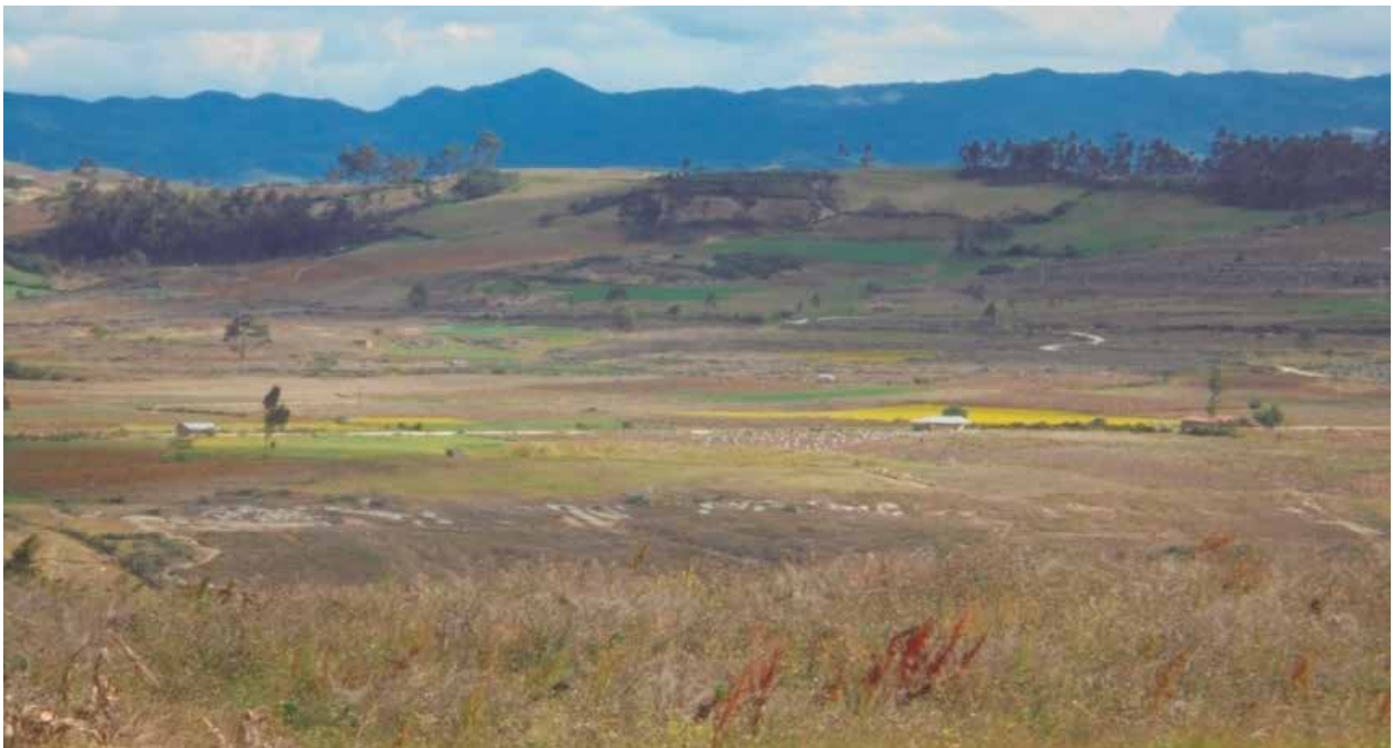
Fig 5: Meseta de Vaquín rodeada por cavernas