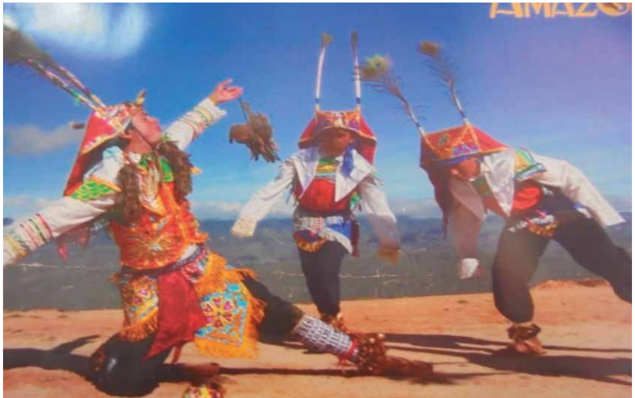
Fig. 12: Representación de la Danza del Chuquiac