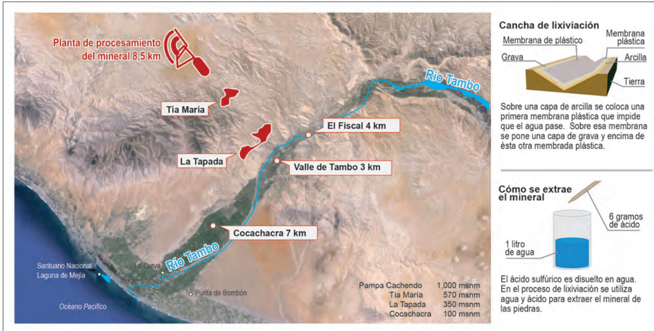
Proyecto Minero Tía María. Abril 2015.