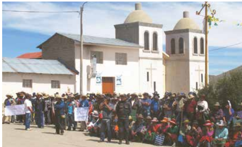
No se han registrado actos que afecten el orden público que justifiquen la continuidad del estado de emergencia.

la asimetría respecto al poder que reina en ese centro minero.