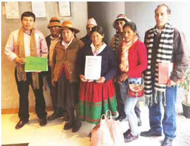
La Bambas: 120 días de estado de emergencia «preventivo». Delegación de Cotabambas en reciente visita a Lima.