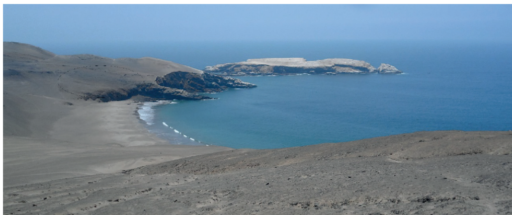
Fig. 3. Vista de Loma Negra, y su entorno geográfico desde el norte.