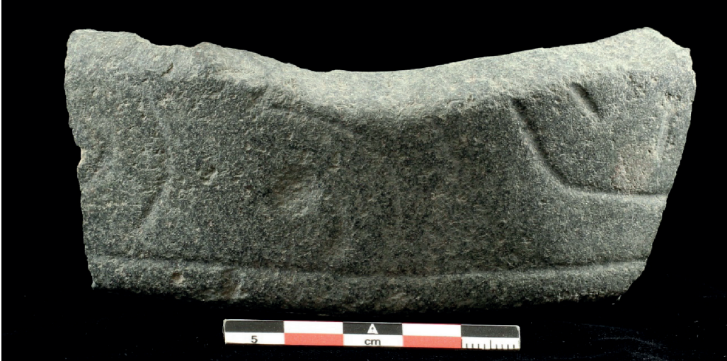
Fig. 4. Mortero decorado identificado en Loma Negra.