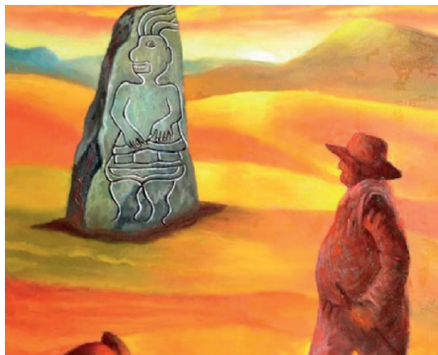
Figura 2. Julio C. Tello: forjando la peruanidad con base en lo indio , pasado-presente-futuro (Obra plástica del ASPAP, 2016).

En ese marco, la historia del propio arqueólogo «indio» Julio C. Tello («emprendedor y resiliente») toma protagonismo en «los nuevos tiempos» del gobierno de Augusto B. Leguía, pues su historia resulta inspiradora y aleccionadora (al haber pasado de ser un hijo de una familia modesta provinciana a un reconocido investigador social en el Perú y en el mundo entero) (Lumbreras, 2007: 10; Mejía, 1948: vi) (fig.2).