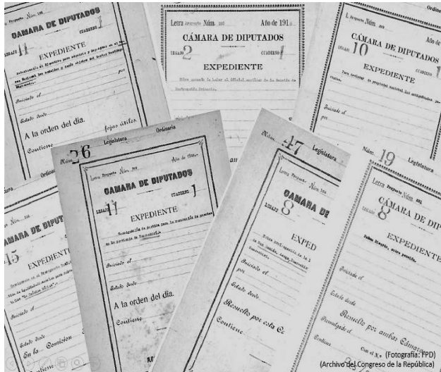
Figura 3. Expedientes de ley de Julio C. Tello.

No obstante, invariablemente sobre el contenido de dichos documentos, como estado del arte, se sabe que Julio C. Tello cumplió un papel relevante dentro del Gobierno de Augusto B. Leguía.