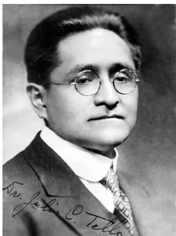
Figura 1. Julio C. Tello. Retrato de su graduación en la Universidad de Harvard, EEUU, s/f.

Julio César Tello Rojas (1880-1947), médico de profesión (fig.1), sin duda, ha sido uno de los intelectuales peruanos más reconocidos y apreciados de la primera mitad del siglo XX por haber llevado con éxito más de 45 expediciones arqueológicas a lo largo y ancho del territorio peruano. Sin embargo, más allá de su loable labor académica en el ámbito de la arqueología; su labor política, como parlamentario de la República, entre 1917 y 1929, es aún, hoy en día, poco conocida y valorada.