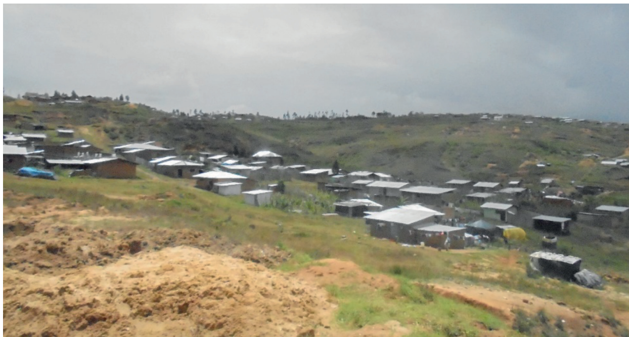
Figura 4. Expansión informal hacia la periferia norte de la ciudad

Asimismo, la construcción de viviendas en zonas de riesgo carentes de control y un plan de ordenamiento urbano, sitúa a la población en un alto grado de vulnerabilidad. Como se puede apreciar estas construcciones están relacionadas con problemas físico-ambientales y urbanos de la ciudad, que, añadido a una configuración topográfica accidentada, consti-