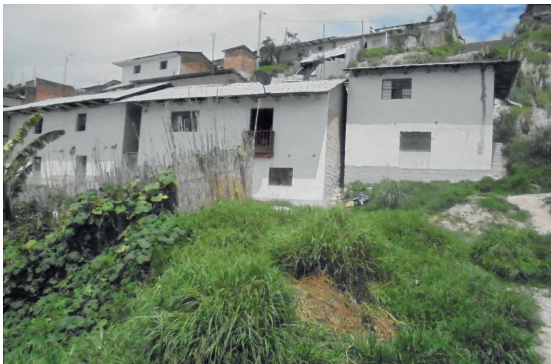
Figura 6. Viviendas construidas en zonas de fuerte pendiente, cerro Luya Urco

Sin embargo a pesar de estos condicionantes topográficos aún se puede rescatar en Chachapoyas la presencia de un manto verde a los bordes de la ciudad integrado por cultivos agrícolas que se localizan en la parte sur y este de la ciudad, así como pequeños bosques de eucalipto ubicados indistintamente en la periferia de la ciudad, además de la imponente vegetación de los bosques de neblina presentes en el cerro Puma Urco principalmente, lo cual permiten contar con microclimas agradables y espacios con valor paisajístico.