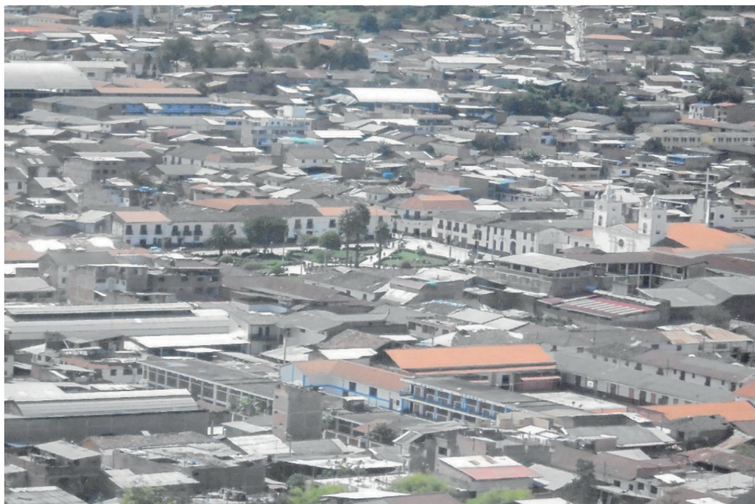
Figura 3. Plaza de armas y parte del área central de la ciudad

dad provincial, la catedral, la gobernación entre otras; su prolongación se dio a través de calles angostas que fluctúan entre 4 a 6.5 m de ancho. Así mismo la característica de las viviendas que conforman esta parte central de la ciudad, es de una arquitectónica correspondiente al siglo XIX e inicios del XX, de configuración homogénea con casonas amplias que generan una agradable perspectiva simétrica en las principales calles de la ciudad, como los jirones Amazonas, Ayacucho, Grau, Ortiz Arrieta, entre otros; donde destacan los balcones de madera tallada que sobresalen de los muros de estas edificaciones. Esta parte central o zona monumental de la ciudad aún mantiene el corte tradicional de la denominada «Fidelísima ciudad de Chachapoyas» (ver fig. 2).