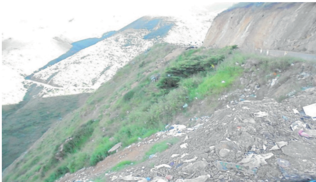
Figura 8. Botadero de residuos sólidos de la ciudad, a tajo abierto de Pishcopata