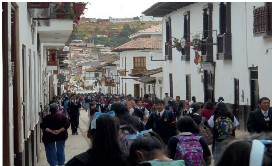
Figura 2. El tradicional Jirón Amazonas, lugar central de la ciudad de Chachapoyas

mientos Humanos, Señor de los Milagros, Santa Rosa de Lima, Murcia, Pedro Castro Alva y 16 de Octubre en la parte norte; Toribio de Mogrovejo, Santa Rosa de Luya Urco al lado oeste; Virgen de Asunta, el Molino al lado sur y suroeste de la ciudad (ver fig. 5).