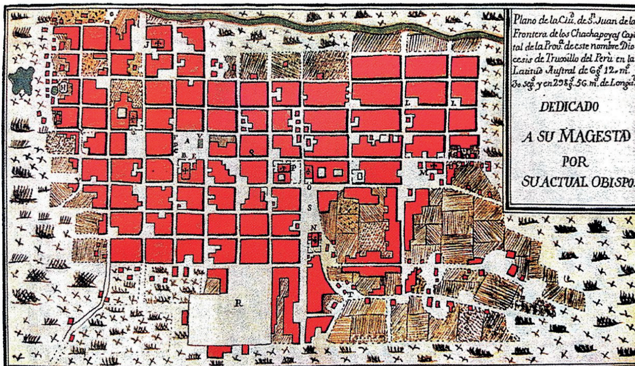
Figura 1. Plano de la ciudad de Chachapoyas de 1782, elaborado por el Obispo Baltazar Jaime Martínez Fuente: Imagen tomada de Huamán Herrera Carlos. Chachapoyas en el tiempo.