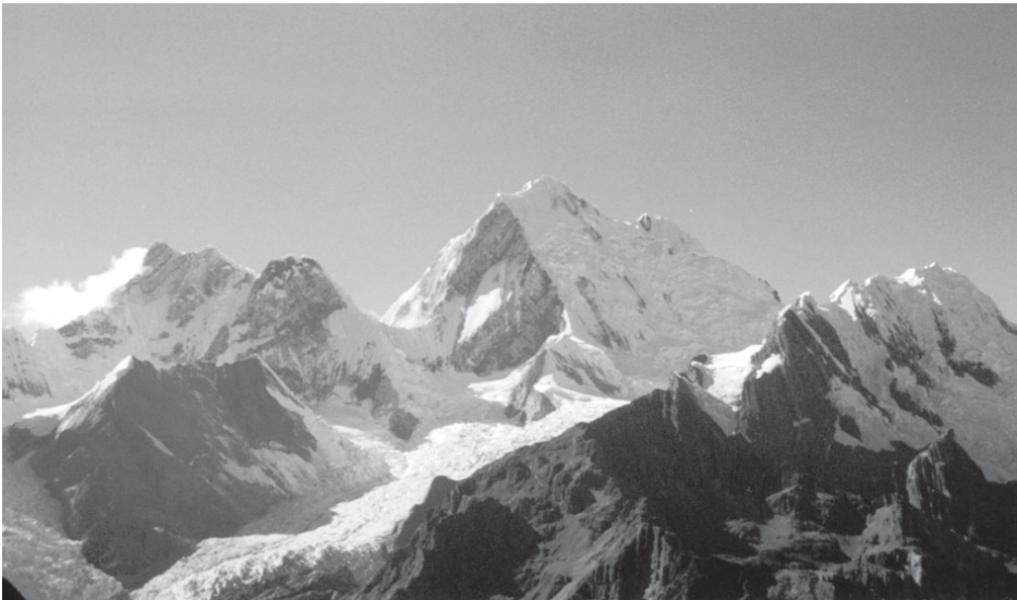
Hermosa vista del gran Yerupajá (6,634 msnm) en una mañana plena de sol.