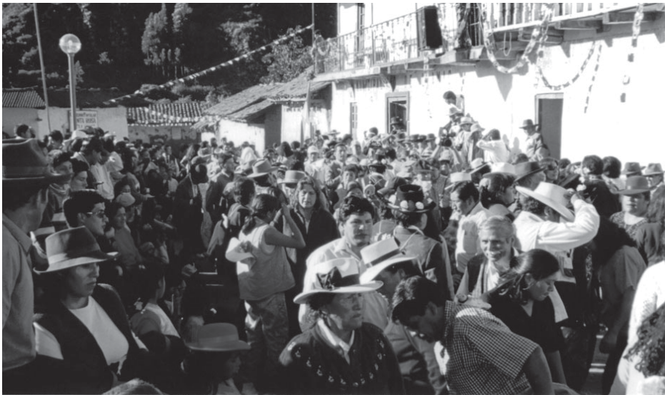
Algarbía popular en Llamac con motivo de la inauguración de la carretera: mayo 2003.