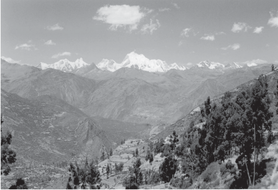
Vista panorámica de la cordillera Huayhuash tomada desde Chiquián.