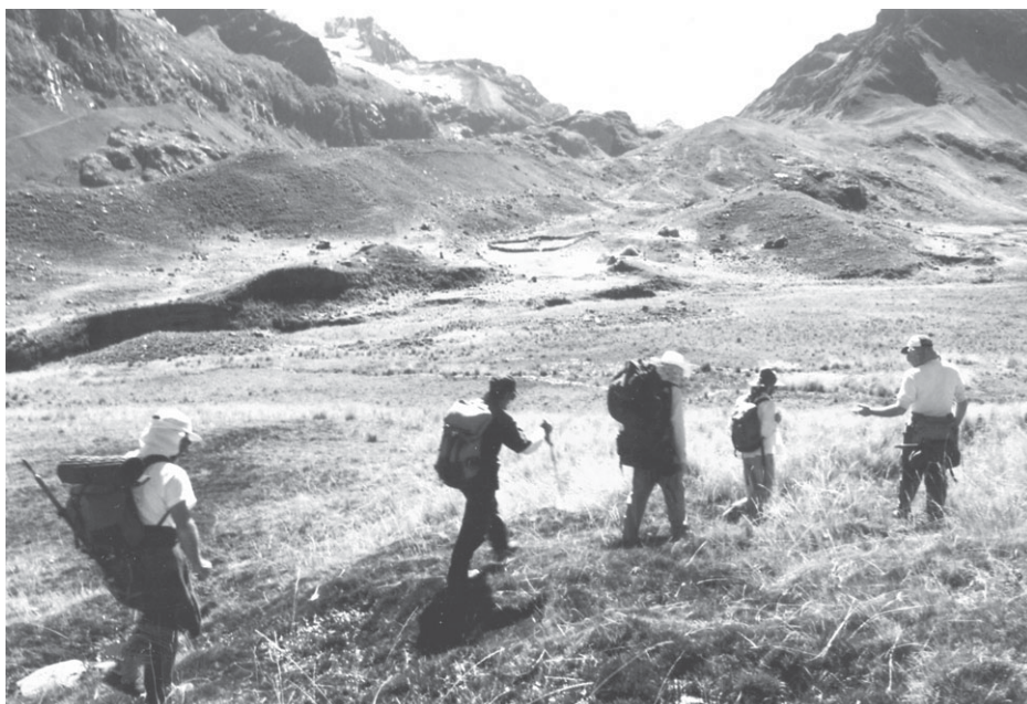
Turistas caminantes pasan por los hatos de pastores de una de las comunidades campesinas con acceso a la cordillera de Huayhuash.