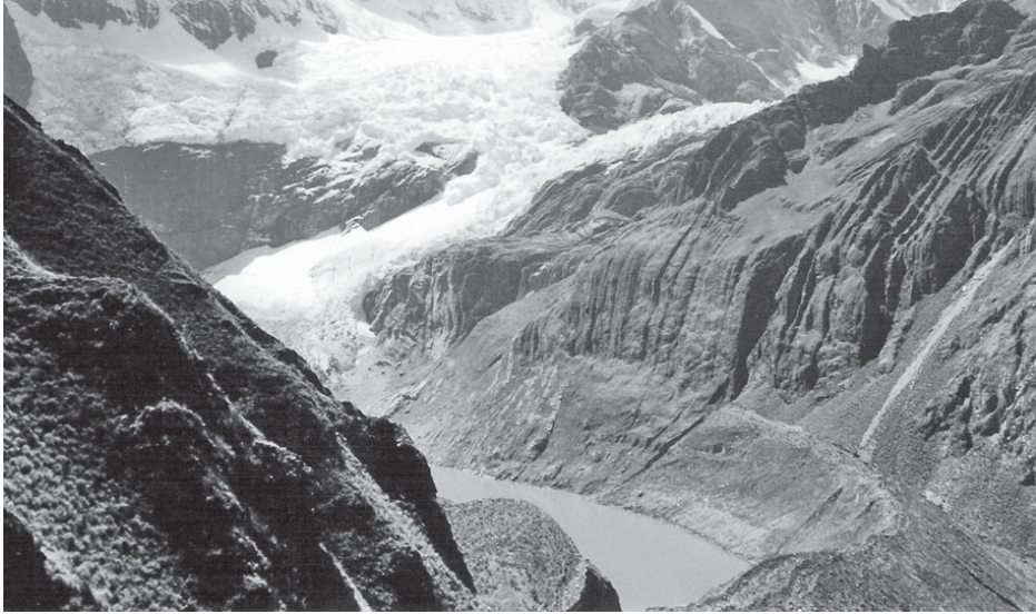
Laguna de Solteracocha de aguas color turquesa formada por los deshielos de los glaciares de la cordillera Huayhuash.