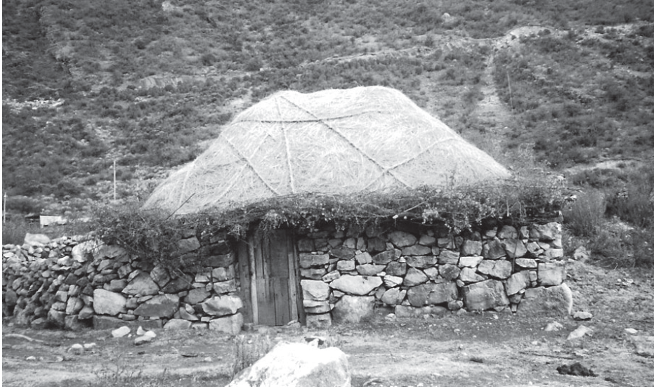
Típica vivienda abandonada de una familia de pastores de la comunidad de Llamac en la planicie de Pallca, hoy controlada por la empresa minera Mitsui.