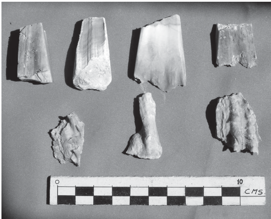
Fig. 5. Objetos confeccionados de la concha spondylus, procedentes de los mares tropicales del Ecuador, encontrados en la Huaca Choque Ispana.

cia de templos que fueron identificados por los evangelizadores de la época colonial quienes señalaron claramente, por ejemplo, a los centros religiosos de Carquín y Choque Ispana adonde peregrinaban gentes que vivían a todo lo largo de las cuencas vecinas al valle de Huaura. Tuvieron, asimismo, dos definidos estilos alfareros, expresados en la vajilla denominada Chancay Negro sobre Blanco y Cayash. La primera con fuerte presencia en la zona yunga de los valles de Huaura y Huaral y la segunda distribuida tanto en la región costera como en la parte altoandina donde es predominante. Queremos añadir que de los fragmentos observados en Choque Ispana nos llama la atención uno que tiene un dibujo antropomorfo en la superficie, de cuya cabeza se proyectan a manera de dos rayos que pueden tal vez ser la representación de la misma imagen que estaba grabada en la escultura de piedra que el padre Medina destruyó. Ese tipo de figuras aparecen en vasos procedentes del valle de Huaura que inicialmente fueron reconocidos como un estilo del mismo nombre, es decir, de tiempos del Intermedio Tardío. Tal fue la importancia de los Chancay del valle de Huaura que el mismo reino de Chimú había establecido alianza estratégica con ellos, pues uno de sus gobernantes, precisamente Minchancaman , había tenido un hijo en una noble haurina,