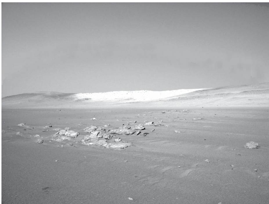
FIG. 3. Vista del conchal situado junto al Templo de Choque Ispana. Aquí se encuentran restos de mariscos, fragmentos de cerámica, huesos de pescado y de mamíferos marinos.

rayos que se proyectan de la cabeza. Este combina los colores negro blanco y rojo. El fragmento con relieves denota dos líneas horizontales cerca del borde y puntos circulares, tal como suelen aparecer en utensilios del estilo Pativilca.