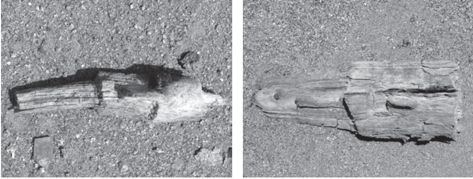
FIG.6. Objetos de madera con rostro antropomorfo que yacen en la superficie del cementerio adyacente al Templo de Choque Ispana. Estos objetos acompañaban a los fardos funerarios que allí fueron inhumados.

Las tallas de madera (Fig. 6), representan pequeños rostros humanos con tocado, nariz, boca y los ojos bien señalados, pero deteriorados por haber sido expuesta a la acción del ambiente desértico. Poseen un vástago el cual servía para ser introducido en los fardos funerarios como una señal de la identidad del difunto. En otros cementerios del valle de Huaura hemos observado la existencia de falsas cabezas hechas de madera o de algodón en forma de cojines pintados, pero difieren de las de Choque Ispana por ser más grandes y llevar incluso cabellera. La presencia de estos objetos sugiere que algunos enterramientos corresponden a personas de un nivel social de importancia, toda vez que su ocurrencia no es generalizada en los cementerios del valle de Huaura. Por lo menos es eso lo que hemos constatado en las exploraciones de muchos espacios funerarios en los cuales suelen ocurrir dichos hallazgos. Objetos de madera de diversos tipos son frecuentes en las sepulturas de la cultura Chancay en forma de mazos, falsas cabezas, orejeras, varas, cajas, instrumentos para el tejido, tal como lo atestiguan los hallazgos de Ancón (Reiss y Stübel, 1988) y las del valle de Chancay (Cornejo, 1999) como indicadores de diferenciación social.