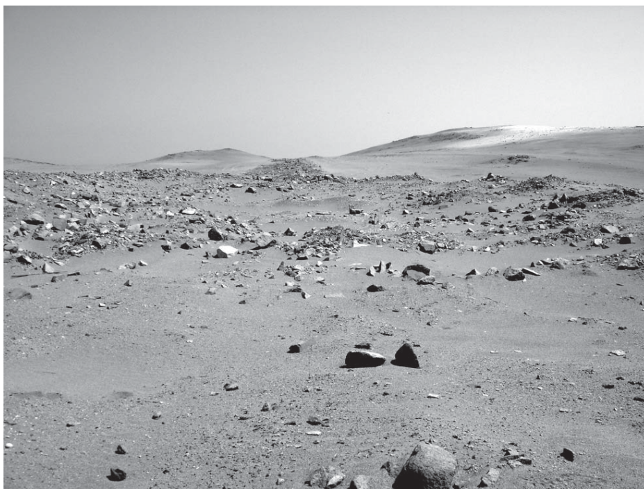
FIG. 4. Vista del estado actual del Templo de Choque Ispana, erigido en pleno desierto, a orillas del Océano Pacífico. Todavía se encontraba vigente en el siglo XVII, pero fue destruido por el visitador Felipe de Medina.

curas, anotando previamente los nombres de todos ellos para un auto próximo. Continúa el informe de la visita con datos sobre Carquín y otras denuncias de hechicerías.