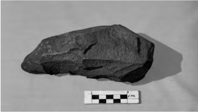
Fig. 7. Martillo de piedra elaborado a percusión el cual sirvió para tallar las Ventanillas de Allpas. Fue identificado justamente al pie del acantilado rocoso donde se encuentran las cavidades mortuorias.