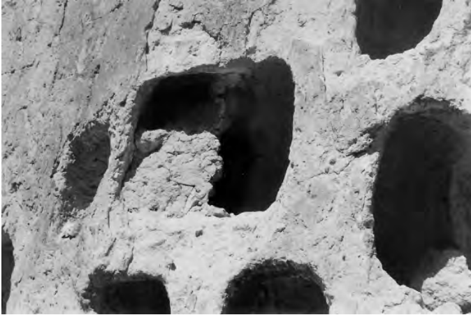
Fig.5. Vista de un nicho o ventanilla en Allpas que conserva la cobertura o lápida de la tumba, la cual fue construida utilizando piedras pequeñas unidas con barro. Finalmente esta lápida era pintada de color rojo y crema.