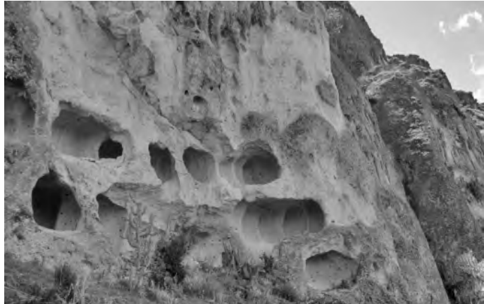
Fig. 10. Ventanillas de Huayrapuncu en el complejo arqueológico de Killihuay del distrito de Congalla, provincia de Angaraes, región de Huancavelica.

riores al presente e incluso ellas fueron claramente diferenciadas en su función y rasgos generales, tal como lo testimonia la versión del historiador Charles Wiener hacia fines del siglo XIX. Y tanto por esta referencia como por las observaciones que realizamos posteriormente, en cuanto al hecho de haber encontrado algunas ventanillas con restos óseos humanos y vestigios de lápidas, se confirma la función que tuvieron. Esto es, para servir de sepulcros, tal como sirvieron las conocidas ventanillas del área de Cajamarca y otras ubicadas en las vertientes del Marañón al Norte del Perú.