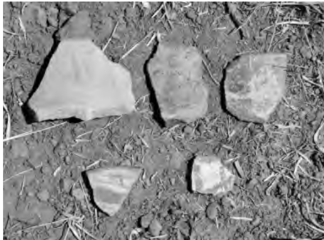
Fig. 8. Fragmentos de cerámica encontrados en la superficie de los terrenos aledaños al complejo funerario de las Ventanillas de Allpas. El primer fragmento es sencillo, los dos adyacentes pueden pertenecer al Horizonte Medio. Los dos fragmentos de la parte inferior corresponden al estilo Coras del Período Intermedio Tardío de la región de Acobamba, Huancavelica, muy similar a los estilos del mismo período del valle del Mantaro y Ayacucho. (Foto A. Ruiz Estrada).

mediante un trabajo de lascado a percusión, cuyas huellas son claramente visibles en la superficie de la herramienta. El ejemplar que observamos tiene un largo de 0.18 m, con un espesor de 0.07 m. En realidad estamos frente a un verdadero instrumento para picar, cuyas características indican ser un artefacto idóneo destinado a desgastar la roca con la finalidad de obtener las mencionadas concavidades mortuorias (Fig. 7).