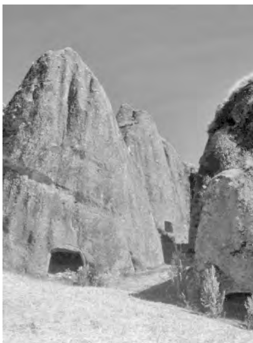
Fig.11. Altas tobas volcánicas del sitio de Rumihuasi, las cuales exhiben grandes nichos cuyas dimensiones superan a todas las existentes en las provincias de Acobamba y Angaraes. Se trata de tumbas grandes destinadas a personajes de mayor prestigio social en tiempos antiguos.

tran los depósitos de ofrendas de Ayapata en el distrito de Caja. Para las ventanillas de Cajamarca, tampoco existen evidencias de asociaciones directas definidas, pese a que ya Tello en el siglo pasado indicó su asociación con alfarería de tipo Maraón, pero con este término genérico en esos tiempos se comprendía a objetos de lo que hoy conocemos como de la serie Cajamarca. Al respecto, Tello escribió: « Dentro de los nichos se encuentran huesos humanos muy fragmentados, trozos de laminillas de cobre y tiestos de alfarería del tipo Maraón » (Tello, 1942: 76). Con esa referencia se confirmó la naturaleza funeraria de dichas cavidades y su vinculación con la mencionada alfarería Cajamarca, en términos generales pero imprecisos en cuanto a su real antigüedad. En tiempos posteriores se ha considerado como vinculadas, en unos casos a la fase Cajamarca III, en otros a la fase Cajamarca IV y algunas que no son fechadas, como se observa en la mención que se hace de las ventanillas de Malpaso, San Cristóbal, Cerro Ventanas. Shinchin Callanacas, Huacaloma, Quebrada de las Pencas. Combayo, Coñores, Miraflores, Otuzco, Río Grande, Atuintion, Tranquilla (Ravines, 1985).