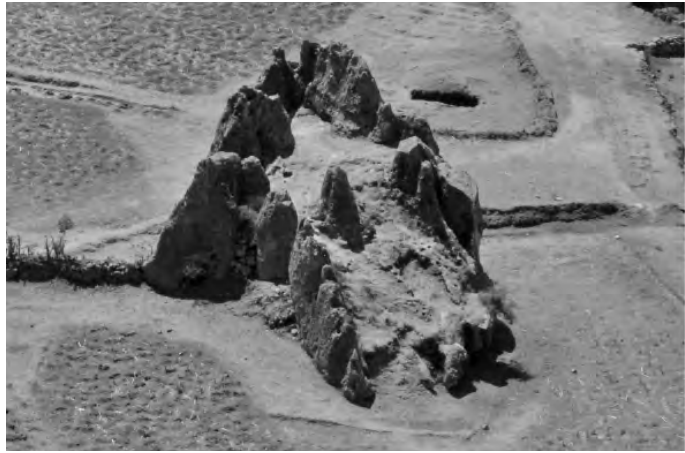
Fig. 6. Conjunto rocoso ubicado al pie de las Ventanillas de Allpas. Presenta un vestíbulo de acceso que conduce al pequeño atrio rodeado de bloques cónicos. Estas características sugieren que el conjunto puede haber servido para cumplir los rituales en las ceremonias fúnebres antiguas.(Foto A. Ruiz Estrada).

de ellas alcanza unos centímetros más. En cuanto al tamaño de las ventanillas, una muestra de las medidas tomadas a veinte tumbas, indica que la altura de las cámaras varía entre 0.91 m y 0.39 m, el ancho entre 1.10 m y 0.22 m, con una profundidad que fluctúa entre 0.74 m y 0.24 m. Por lo común la cámara interior presenta una mayor altura, por el hecho de tener la base más hundida que la boca, habiéndose registrado que la concavidad interna alcanza alturas que varían entre 1.10 m y 0.36 m, lo cual servía para contener el bulto funerario.