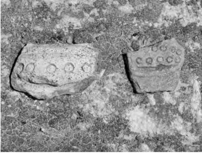
Fig. 9. Fragmentos de cerámica identificados en terrenos aledaños al complejo funerario de las Ventanillas de Allpas. Presentan decoración de bandas aplicadas con círculos estampados. El estilo de estos objetos indica su correspondencia al estilos del Período Intermedio Tardío de la provincia de Acobamba, Huancavelica, muy similar a los estilos del mismo período del valle del Mantaro y Ayacucho.