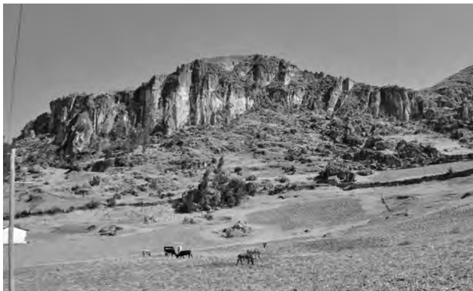
Fig. 2. Vista panorámica del cerro en cuyo flanco del lado oriental se localizan las Ventanillas. Anexo de Allpas, provincia de Acobamba (Huancavelica).

Los cerros que sirvieron para cavar las tumbas no son muy elevados y tampoco se hallan muy alejados del poblado de Allpas, por lo que su acceso no presenta obstáculos mayores. Si bien se conoce al complejo funerario con ese nombre, algunos sectores de él, tienen denominaciones como Manchailla, Mocucho, Ururumay y Trancajasa.