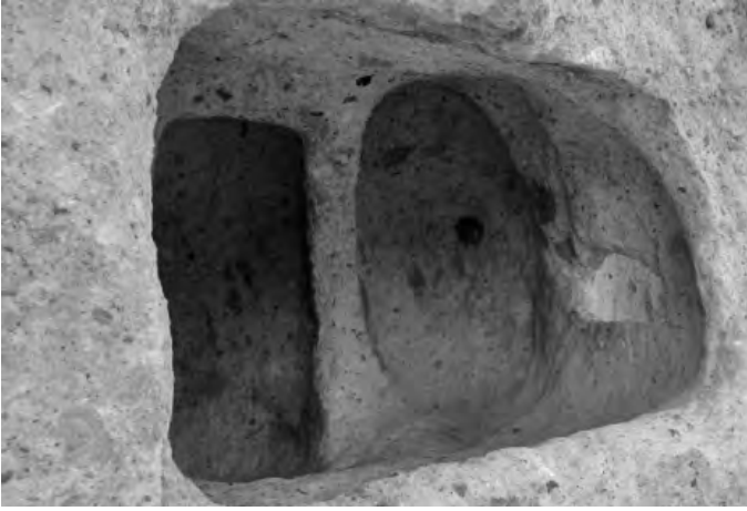
Fig. 12. Ventanillayoc, tumbas al pie del sitio arqueológico de Marcapata, anexo de Carcosi, distrito de Congalla, provincia de Angaraes, región de Huancavelica. Esta ventanilla presenta tres divisiones internas.