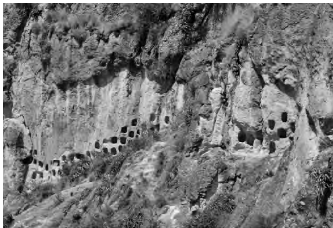
Fig. 4. Las ventanillas de Allpas se distribuyen al pie del enorme farallón rocoso, sobre la pared vertical del acantilado. No se hallan a gran altura y son accesibles desde el talud del cerro.

tuvo su vigencia durante el Período Intermedio Tardío en el cual se enmarca la sociedad Angara. En plena vigencia y apogeo de estos Angara entró en la escena regional de Acobamba la hueste cusqueña que impuso nuevas formas de gobierno y cambios en las relaciones económicas, toda vez que las decisiones políticas emanaban de la ciudad capital del Imperio Incaico, esto es desde el Cusco, soslayando el mando de los curacazgos regionales.