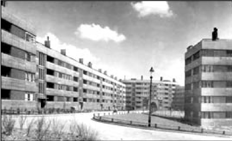
Quarry Hill (Leeds).

Schwarz, donde pudo tener una experiencia directa del modernismo (Samuels, Paneiran, Castex y Depaule, 2004: 91; Rincón, 2004: 179).