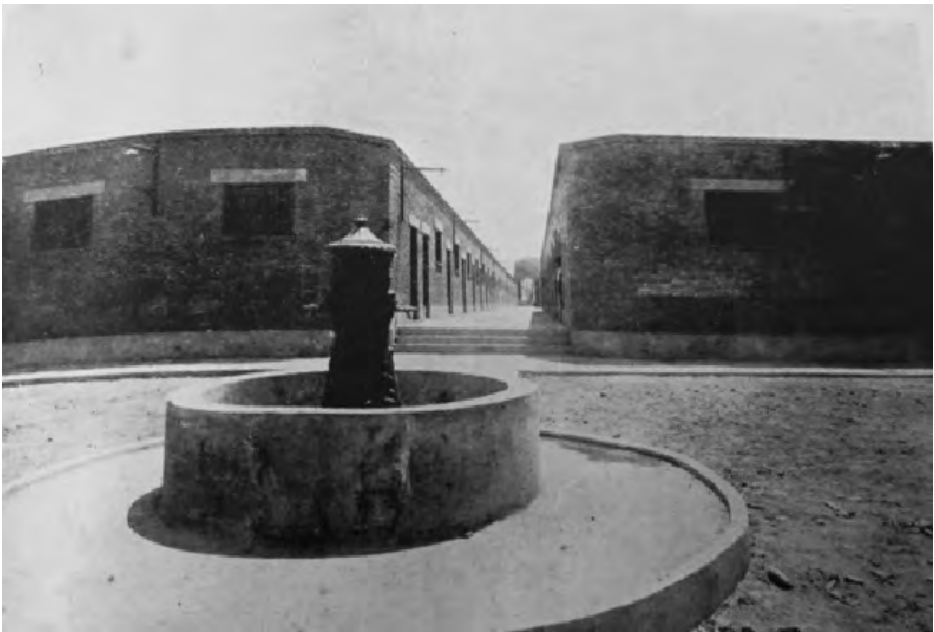
Pileta central de Casa para Obreros 1932.

En este proyecto los requerimientos fueron los siguientes: cimiento y sobrecimiento de concreto, muros de ladrillos, techo de concreto, acabado interior de yeso con cielo raso moldurado, piso de madera en dormitorio, pisos de loceta y cemento en las demás áreas, instalación eléctrica empotrada, sanitario extranjero y