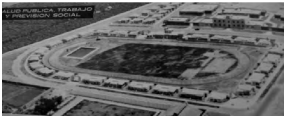
Barrio Obrero N 1 (Huerta Mendoza) 1937.