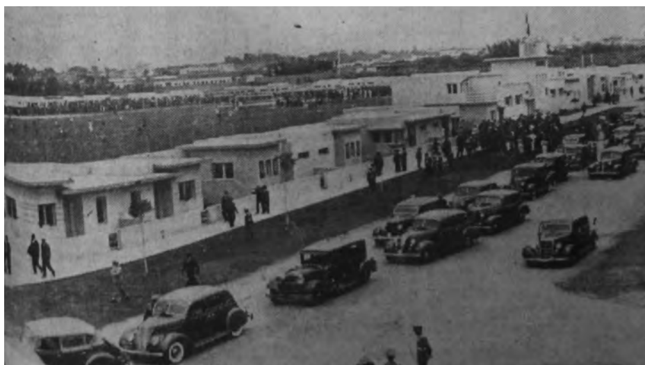
Barrio Obrero N. 1 (1937).

una cocina para carbón. La fachada exterior estaría revestida con cuarzo. El Estado suministraría el cemento Portland, los sanitarios, la cerrajería y la conexión al agua potable y desagüe. El concurso público lo ganó la Oficina Técnica Michel Fort.