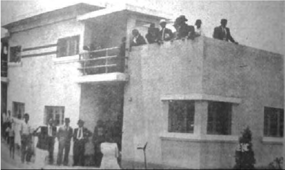
Casa del Barrio Obrero N. 2 (Rímac).

el campo deportivo tiene acceso directo a la calle por medio de cuatro portadas. La inauguración de los campos deportivos en el proyecto habitacional contó con la participación de los equipos Eleven Boys y Atlético Libertad (fútbol), la Escuela Nacional de Educación Física el Naranjo y los Eléctricos del Rímac (basquetbol), y Universitarios y Cachorros (waterpolo).