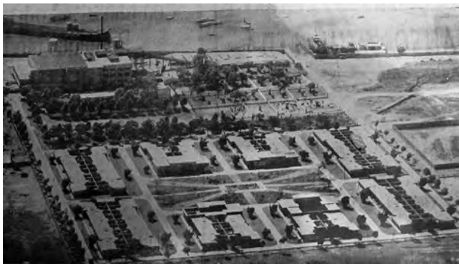
Barrio Obrero Frigorífico Nacional S. A. Ltda (Callao).