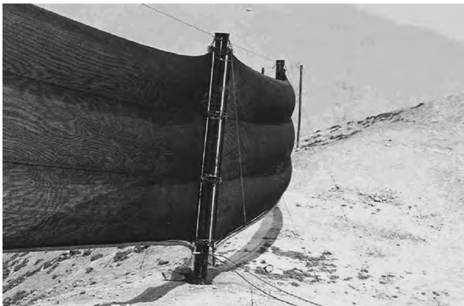
El atrapaniebla es una malla especial de raschel, importada de Chile o de Francia.

Madre de familia en su terreno de 1000 m 2 en La Meseta, luego de haber recibido el agua de niebla.