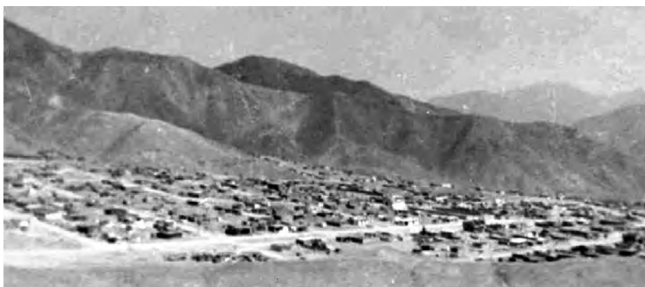
La zona de Manchay camino hacia la Meseta es de tierra arenosa sin vegetación.