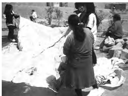
Participación de las comuneras en la confección del toldo de rafia para el local comunal.