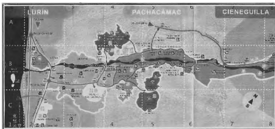
Mapa de la Comunidad Campesina de Collanac- Manchay y la Meseta se ubican en el distrito de Pachacamac, que se encuentra entre Cieneguilla y Lurin.

La comunidad de Collanac-Manchay-Meseta se encuentra en la periferia de un sistema cordillerano mayor que constituye un todo homogéneo, por su espacio cruza el río Lurín que desemboca en el mar. La zona de Manchay se encuentra abierta hacia el sur, por el valle del río Lurín, es el conducto obligado de penetración de las nieblas (Tecnides).