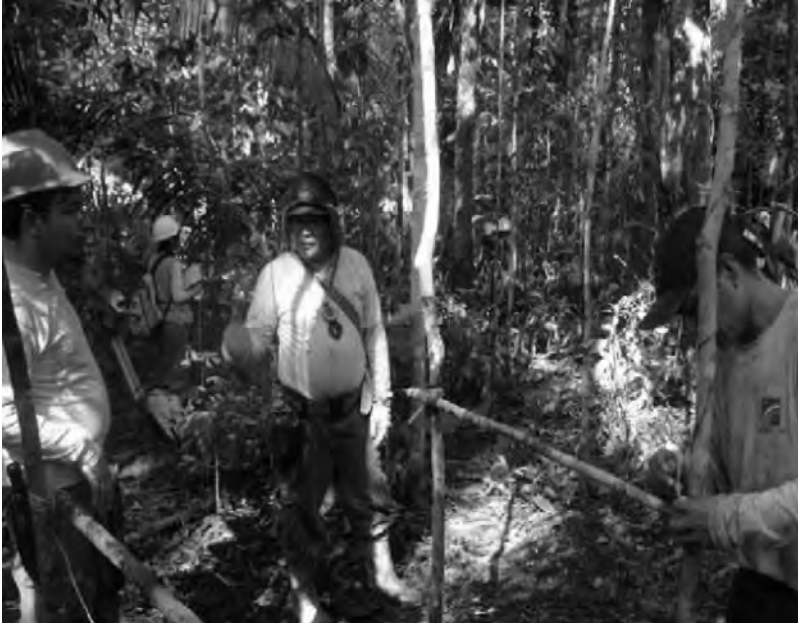
Fig. 6. El autor y sus colaboradores en la identificación del sitio de Shanakunga