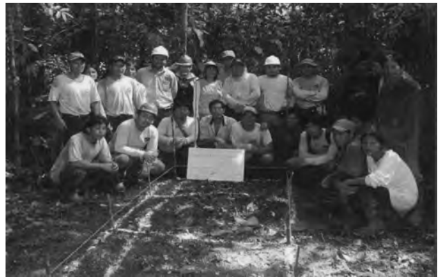
Fig. 9. El autor y sus colaboradores en Shanakunga