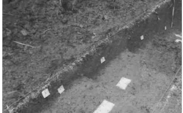
Fig.7. Excavación en el sitio de Shanakunga

RENFREW, Colin (1998). Arqueología. Teoría, métodos y práctica . Ediciones Akal.