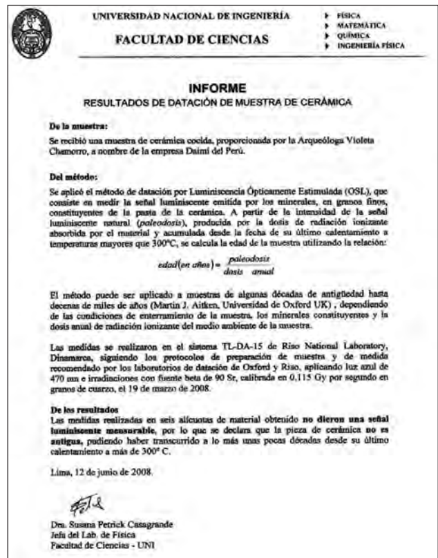
Fig. 10. Resultados de la evaluación arqueológica