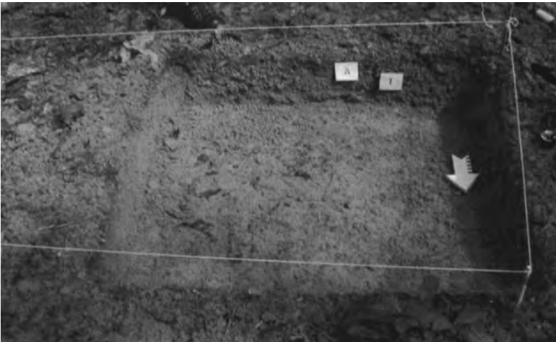
Fig.3. Trabajo de excavación en el sitio Argentina