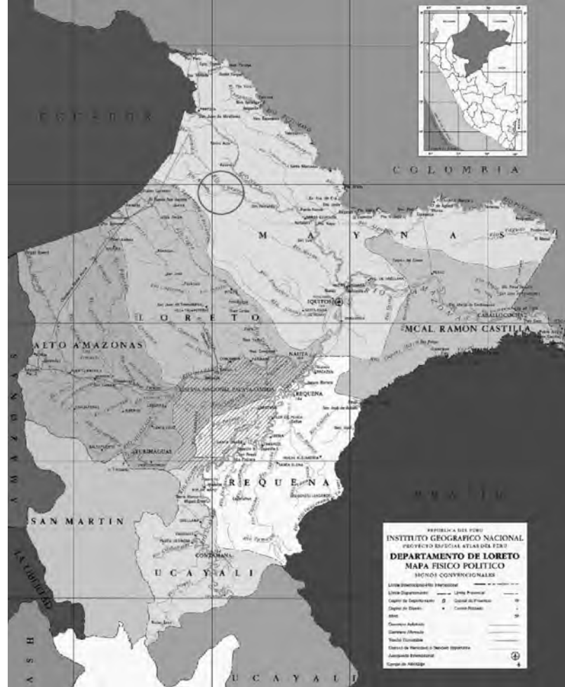
Fig. 2. Mapa político de la región de Loreto, nótese la etnia de Arabela que está encerrada en un círculo, colindante a los ríos Curaray y Arabela, afluentes del río Napo.

Tras escoger los sitios señalados por la prospección se procedió a la limpieza del área, procediendo al trazado de las cuadrículas de «1x1 m 2 », estableciendo que la profundidad de la excavación se seguiría por estratos naturales y niveles arbitrarios, recurriendo a la localización tridimensional de los hallazgos y al registro fotográfico y filmico correspondiente.