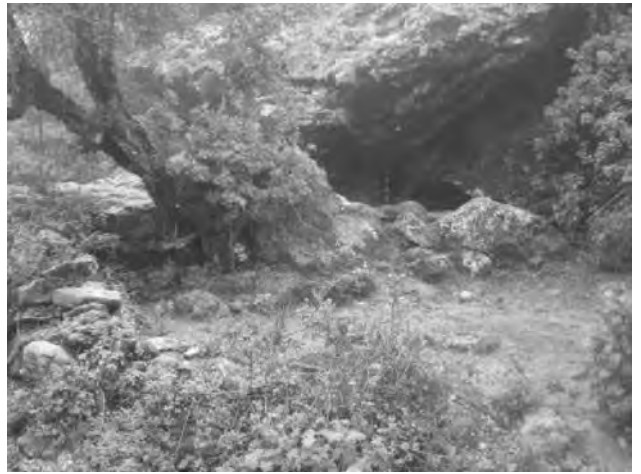
Al fondo vista de los dos Ushnus