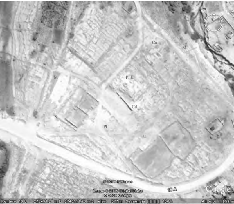
Leyenda: K: Kanchas. P. E.: Plataforma Elevada. Pl.: Plaza. U: Ushnu. Cd.:Cuadrilátero. M: Muralla 1. Cu: Cúpula.