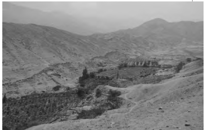
Figura 18 (Superior izquierda): Muralla 1, lado Sur Oeste del Sector A. Figura 19 (Superior derecha): Muralla 1, lado Norte del sector B. Figura 20 (inferior izquierda): Vista de la muralla en el cono de deyección de la quebrada de Lumbra, al Este del Sector D. Figura 21 (inferior derecha): Vista panorámica de la muralla por la quebrada La Mina.

producto de arrastre aluvial (huaycos), por como se introduce en las zonas más profundas. Esto se deduce de la observación de troncos de arbustos que crecen en la capa C, interrumpidos en su crecimiento hacia la superficie de esa capa, los que no continúan en la capa B. Los materiales culturales identificados serían producto de arrastre.