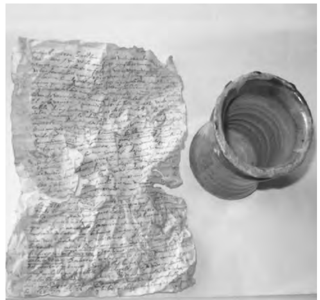
Figura 24 (Superior izquierda): Unidad 11 al inicio de la excavación. Figura 25 (Superior derecha): Unidad 11, Piso 1. Figura 26 (inferior izquierda): Hallazgo del vaso colonial, unidad 11, capa B. Figura 27 (inferior derecha): Vista del vaso colonial, con el documento que contenía en su interior.

A partir de la información estratigráfica se ha podido identificar tres fases de ocupación de esta área de la plataforma elevada: