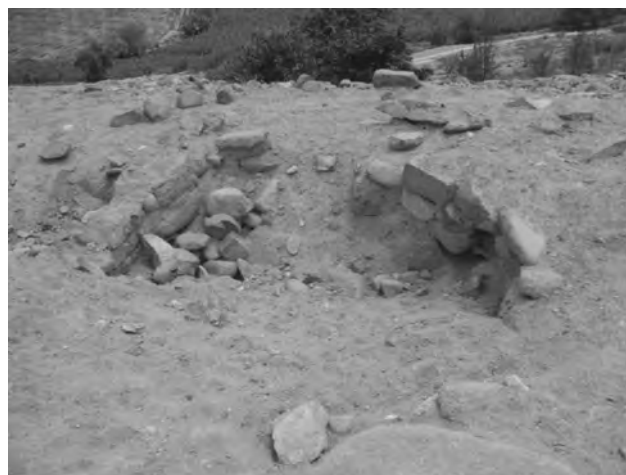
Figura 14 (Superior izquierda): Vista satelital del sector D, sector doméstico. Figura 15 (Superior derecha): Vista del sector E. Figura 16 (inferior izquierda): Vista de uno de los recintos circulares del sector F. Figura 17 (inferior derecha): Vista de una estructura subterránea circular.