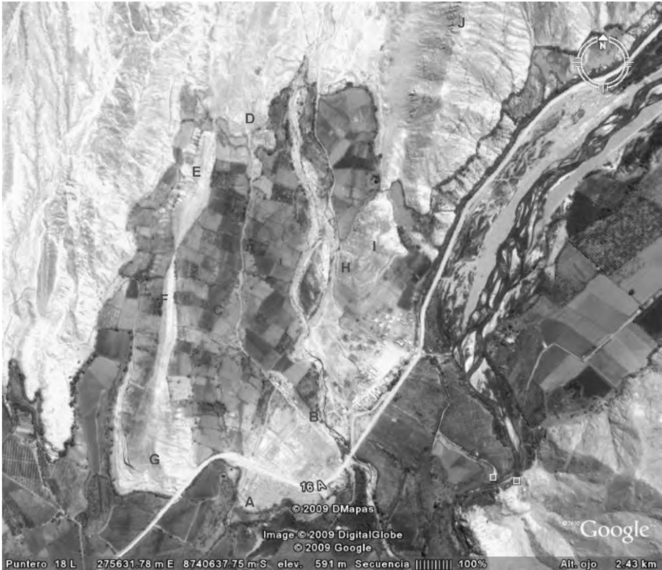
Figura 1: Vista Satelital del complejo arqueológico de Lumbrá, con sus sectores integrantes.

con muros de contención hechos a base de piedras canteadas medianas. Estas terrazas están articuladas mediante un sistema de canales conectados al canal matriz que ingresa a la quebrada por el lado oriental, trayendo agua desde la bocatoma ubicada en Paso Broncano, del río Chancay. En los últimos 30 años estas terrazas han sido reutilizadas.