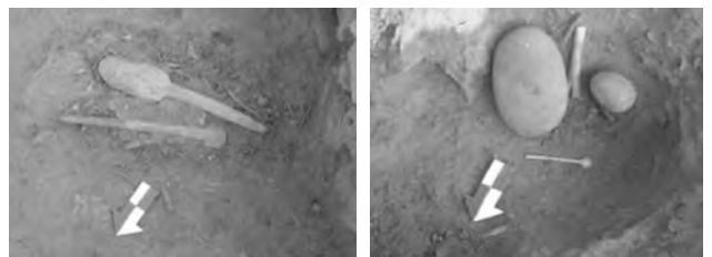
Figura 2 (Superior izquierda): Vista panorámica del sector A. Figura 3 (Superior derecha): Vista de uno de los recintos excavados del sector A. Figura 4 (medio izquierda): Vista panorámica de una amplia estructura rectangular, sector A. Figura 5 (centro derecha): Vista de un recinto con banqueta, excavado en el sector A. Figura 6 (Inferior izquierda): estructura funeraria subterránea, sector A. Figura 7 (Inferior medio): cerámica recuperada del Sector A. Figura 8 (Inferior derecha): instrumentos recuperados en el interior de los recintos durante las excavaciones en el sector A.