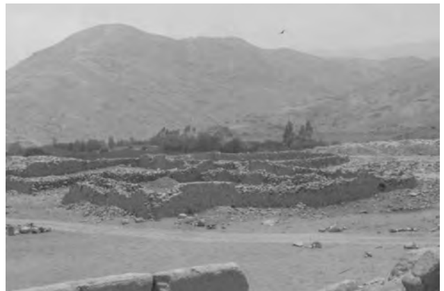
Figura 9 (Izquierda arriba): Vista de la foto satelital del Sector B, con la ubicación de los principales componentes. Figuras 10 y 11 (Izquierda abajo y derecha arriba): El Ushnu, Sector B, en dos vistas. Figura 12 (Derecha centro): Vista panorámica del muro perimétrico Oeste y Sur del cuadrilátero. Figura 13 (Inferior derecha): Vista panorámica de las Kanchas Tawantinsuyu.

de piedras canteadas de forma rectangular. En el interior de estas estructuras, se halló cerámica tardía como fragmentos diagnósticos de ollas grandes de cuello pequeño. Estas construcciones cumplirían una función de depósito.