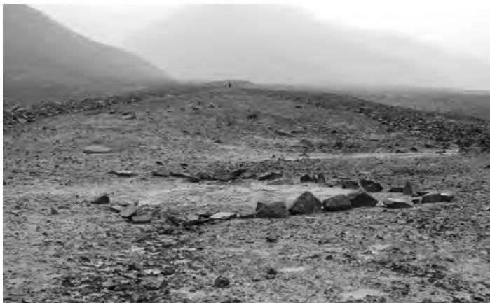
Plazoleta, hallada en quebrada Carnero