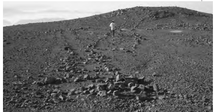
Conjunto de figuras situado en la cumbre sur de cerro Colorado