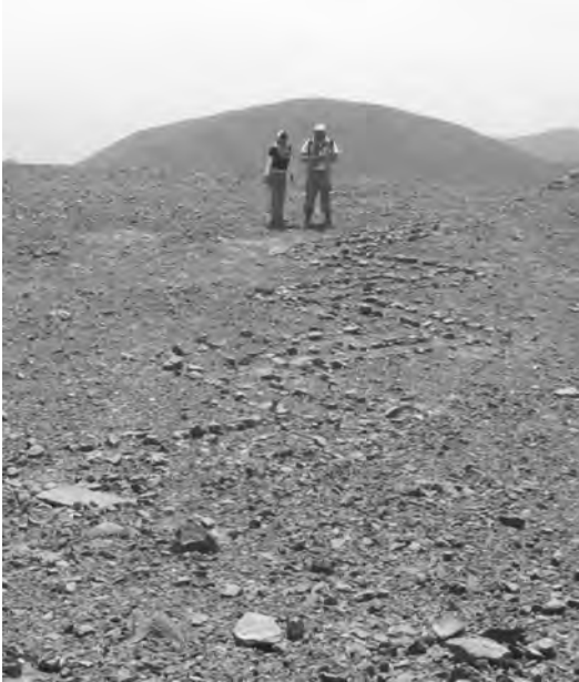
Uno de los pocos geoglifos figurativos, representa a una serpiente.