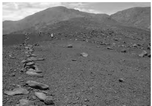
Enorme figura próxima a la cumbre del santuario