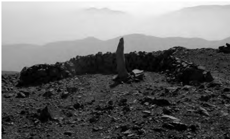
Huanta al interior de un recinto semicircular, situado en la faldas de cerro Colorado