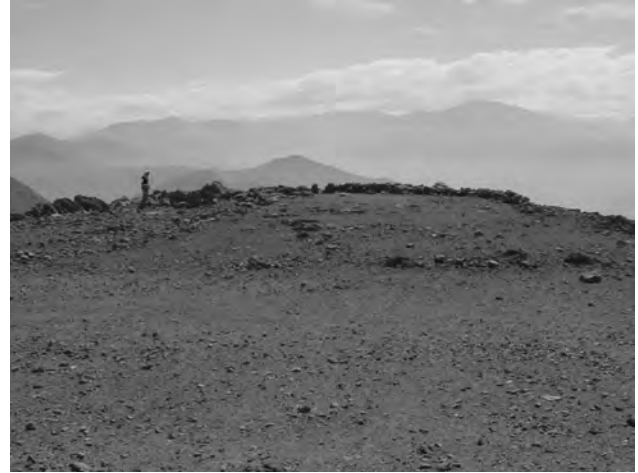
Vista parcial de la cancha situada en la cumbre de cerro Colorado