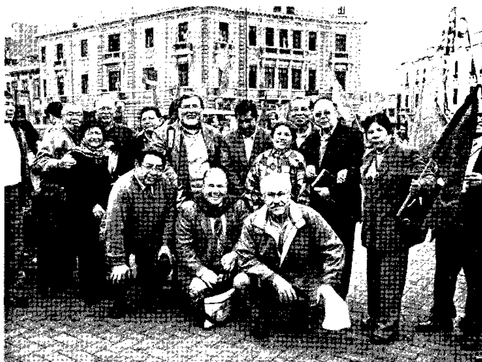
Marcha docente por homologación. Diciembre de 2007.

que la gran mayoría de docentes de San Marcos procede de otros departamentos que no es Lima y en algunos casos son limeños pero hijos de inmigrantes provincianos. Según los datos del censo docente realizado por la Oficina Técnica del Estudiante (2002), un buen porcentaje de docentes tienen procedencia provinciana (no limeña). Muchos de ellos tienen como lengua materna el quechua en sus distintas variantes. Asimismo, se puede observar los cambios en cuanto al ascenso social de padres a hijos. Una gran mayoría de docentes que provienen principalmente de los departamentos de Ancash, Huánuco, Cerro de Pasco y Ayacucho hablan con fluidez su lengua materna que es el quechua. Pero tampoco dejaron de aprender otros idiomas extranjeros, una gran mayoría de ellos hablan y escriben el inglés, francés, el portugués o el italiano. El hecho de haber estudiado en la misma universidad hace que un buen sector de docentes tenga mucha identificación con su alma máter. Para ellos no es ningún obstáculo el hecho de que los sueldos estén por debajo de lo decoroso. A continuación se presentan algunas entrevistas que dan el perfil aproximado del docente sanmarquino. 12