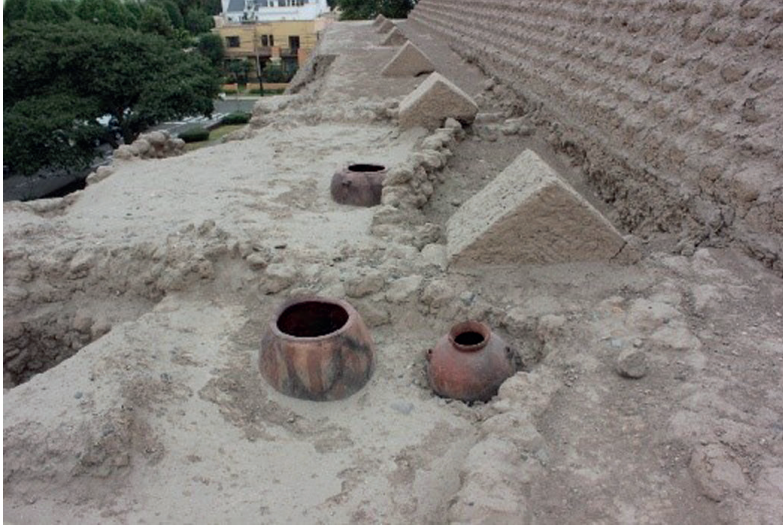
Museografía in situ Museo Huallamarca

Una opción innovadora que se trabaja hoy, utiliza los bienes culturales para dar un enfoque propio al lugar arqueológico, situado en el centro del distrito de San Isidro, en Lima. El antiguo poblador, los ocupantes ancestrales, nos transmiten la forma de vida de periodos preliminares, lo que hoy se conoce como un “distrito corporativo exclusivo”. A partir de ello surgen las interrogantes: ¿De forma subconsciente la comunidad perenniza algunas costumbres ancestrales? ¿Consume elementos culturales que hoy son identificados por la arqueología como propios del poblador del lugar? ¿Se asemejan las reacciones a lo cotidiano en esta zona de la ciudad? Son preguntas que permiten un acercamiento expositivo diferente, que relaciona a los pobladores ancestrales con el habitante actual. La conclusión de este enfoque expositivo es hacer llegar a la comunidad y que comprenda lo que significan los objetos de la colección, trascendiendo los límites del museo desde una visión innovadora y directa (Pearce, 1994).