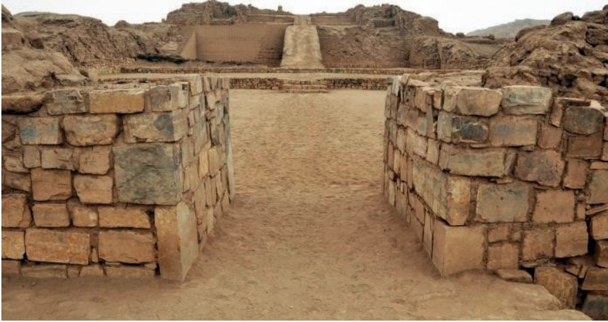
Pirámide con Rampa N° 1.

El trabajo de restauración se realizó a partir de los reconocimientos hechos en el centro arqueológico ceremonial Pachacamac. Por esta razón se consideró incluir una rampa perpendicular a las plataformas para acceder a la parte superior del monumento.