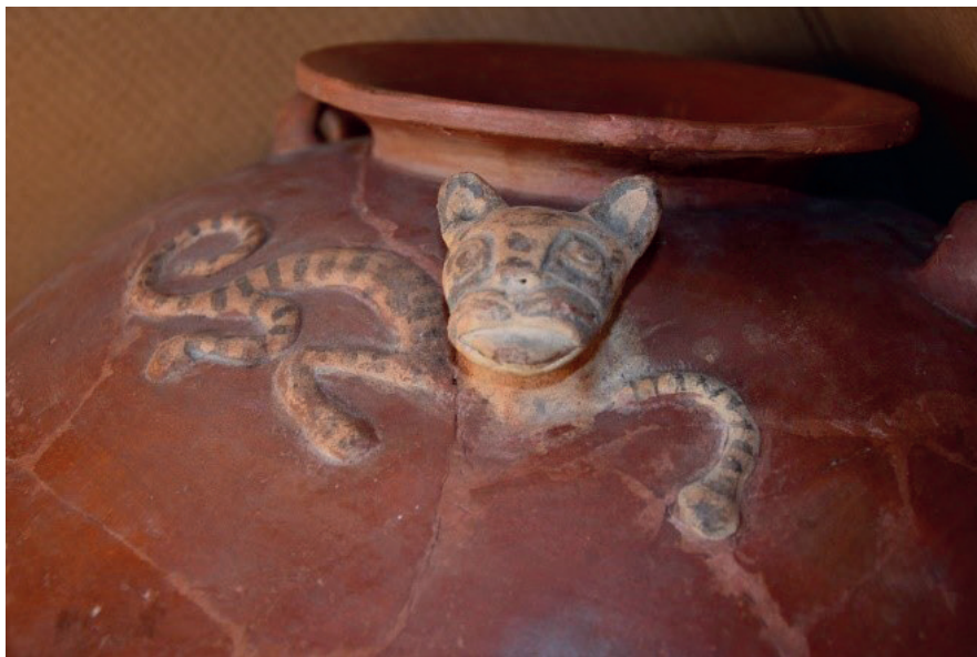
Detalle cerámica decoración felino Museo de Sitio Huallamarca

El plan creado se orienta a beneficiar la colección y el sitio arqueológico, involucrando a la comunidad en su conservación y preservación, con la convicción de que el patrimonio constituye una herramienta primordial para la creación de identidad.