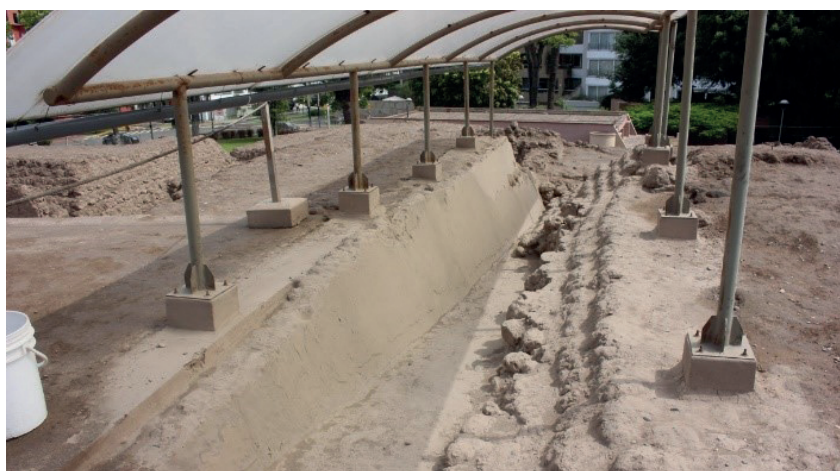
Pintura mural, segunda plataforma Museo de Sitio Huallamarca

Debido a este emplazamiento, en Huallamarca recaen diversas presiones: políticas, turísticas, sociales, culturales; muchas de las cuales no contemplan la conservación preventiva del entorno arqueológico y sus colecciones.