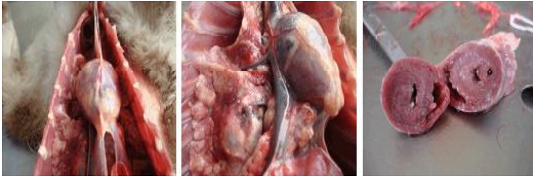
Figura 3. Neoplasias difusas en el pulmón derecho (imágenes del lado izquierdo y del medio). Corte transversal del corazón, donde se aprecia la hipertrofia de la pared ventricular (imagen de la derecha)