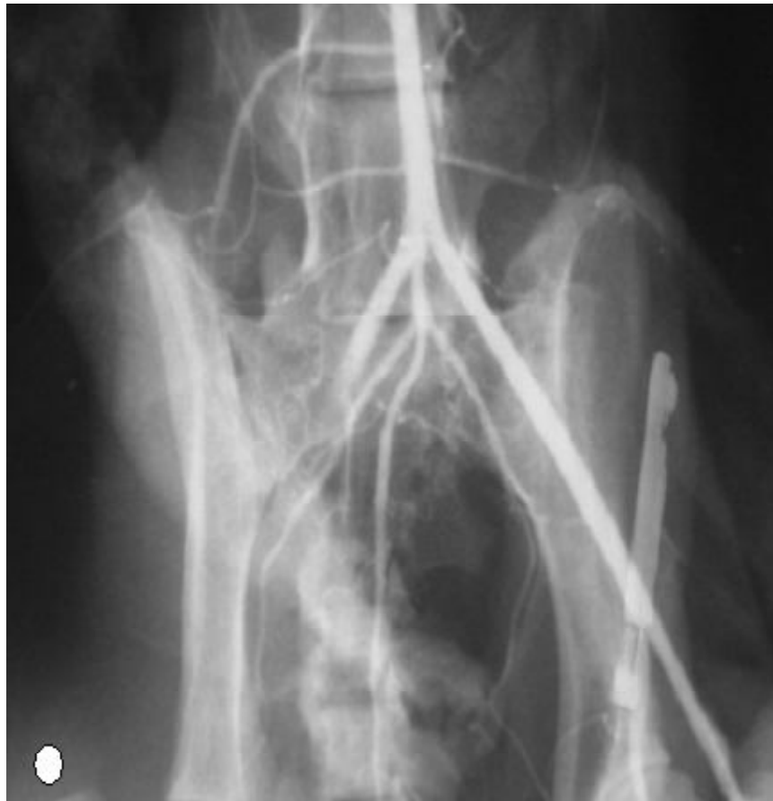
Figura 2. Arteriografía de la cadera de una gata Siamés de 13 años con cardiomiopatía hipertrófica. Obsérvese el bloqueo del pasaje de la sustancia de contraste en la arteria iliaca del miembro posterior derecho. La figura circular marca el lado derecho de la placa radiográfica

el propietario no aceptó al tratamiento por el costo y optó por la eutanasia a las 12 horas de iniciada la atención.