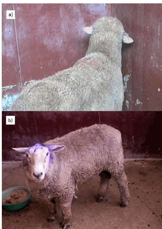
Figura 1. a) Comportamiento preoperatorio: presión cefálica sobre un muro. b) Comportamiento posoperatorio: animal en postura normal

El carnero mostraba estado de conciencia en depresión, presentaba torneo de cabeza y cuello hacia el lado derecho con ataxia e hipermetría anterior derecha. Al caminar mostraba apoyo cefálico en las paredes («head pressing») (Ozmen et al. , 2005); asimismo, tenía síndrome de Horner positivo en el lado derecho, estrabismo ventral del mismo ojo y afasia, presentaba disnea marcada e inapetencia. El paciente presentaba un cuadro de paresia derecha, producto de un síndrome de hemisferio izquierdo (Figura 1a). Según el propietario, los signos clínicos habían sido observados en los últimos 30 días.