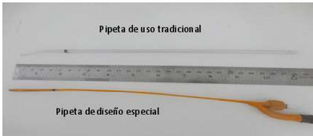
Figura 1. Vista de las pipetas de inseminación artificial