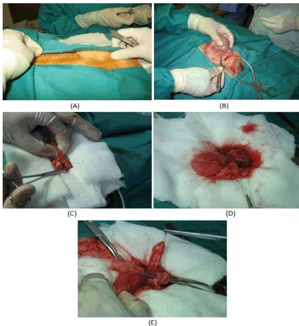
Figura 3. Omentalización prostática. (A) Delimitación del área cutánea para la incisión. (B) Reconocimiento del tejido peri-prostático. (C) Divulsión intra-capsular con pinza hemostática. (D) Colocación del hilo de nylon que servirá de guía al omento. (E) Pasa-je del colgajo de omento a través de la próstata y alrededor de la uretra