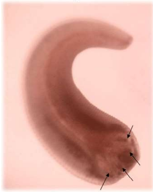
Figura 2. Ninfa de L. serrata obtenida de un linfonodo mesentérico. Las flechas indican la presencia de ganchos en su extremo anterior. Nótese las pequeñas espinas superficiales y las estriaciones en el cuerpo del parásito. 4X

En el presente trabajo, las prevalencias macroscópicas y estereoscópicas obtenidas fueron notoriamente diferentes (11.89% y 0.37%, respectivamente). Esto pudo deberse, entre otros motivos, a que algunas de las lesiones compatibles pudieron ser producidas por otro agente o al tiempo transcurrido entre la infestación del parásito y la toma de la muestra. Caswell y Williams (2007) señalan que la ninfa va degenerándose con el tiempo, por lo cual puede llegar a absorberse o calcificarse dentro de la nodulación. Dado que algunas nodulaciones observadas durante la examinación estereoscópica presentaron material calcificado, pero no la ninfa propiamente tal, no se puede descartar que la ninfa hubiese estado anteriormente presente y que la lesión, por tanto, haya sido de linguatulosis. Para llegar a un diagnóstico más certero y detectar la ninfa de L. serrata , lo ideal sería realizar alguna otra técnica diagnóstica, como, por ejemplo, la digestión enzimática en los órganos bajo análisis (Bamovorat et al. , 2013) o el análisis histopatológico del nódulo y tejido circundante (Muñoz, 2015).