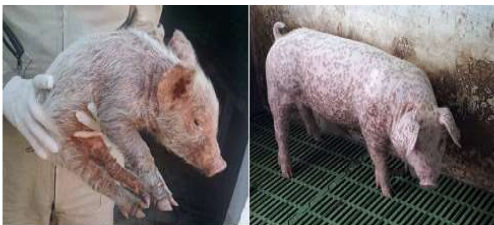
Figura 1. Animales positivos a PCV2 muestreados en granjas del Tolima y Huila. Izquierda: Lechón con signos respiratorios y nerviosos leves, con retraso en el crecimiento comparado con la camada, siendo un animal compatible con PMWS. Presentaba pelo hirsuto y costras en la piel. Derecha: Animal adulto con lesiones cutáneas compatibles con circovirosis porcina

Se tomaron muestras de sangre de 20 cerdas reproductoras de diferentes edades una semana antes del parto, de 20 lechones destetos entre 5 y 10 semanas de vida, de 20 cerdos de levante entre 11 y 16 semanas y de 20 cerdos cebados entre 17 y 23 semanas de cada granja (Figura 1). En ninguna de las granjas se realizaba la vacunación contra el circovirus porcino. Los animales fueron seleccionados aleatoriamente entre cerdos sanos y con signos clínicos relacionados con enfermedades asociadas al circovirus porcino (PCVAD). Las muestras fueron colectadas de la vena yugular mediante sistema BD Vacutainer®, siguiendo métodos de recolección estándar, minimizando el daño o estrés a los animales (Uhart et al. , 2016) para la obtención de sangre completa y suero.