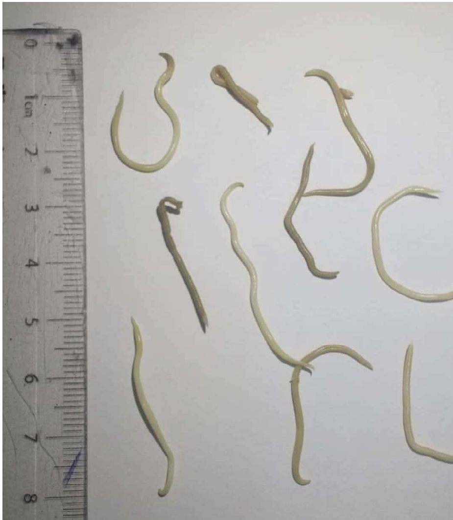
Figura 1. Observación macroscópica de parásitos intestinales encontrados en un espécimen de Leopardus pardalis (Arauca, Colombia)

bo en el extremo posterior, machos con un apéndice terminal y hembras con una vulva en el tercio anterior del cuerpo (Delgado y Rodríguez, 2009). Presentaban entre 1.5 y 6.7 cm de largo, con un promedio de 3.4 cm. Estas medidas de T. cati fueron similares a las reportadas por Pérez e Iglesias (2008) y Gallas y da Silveira (2011).