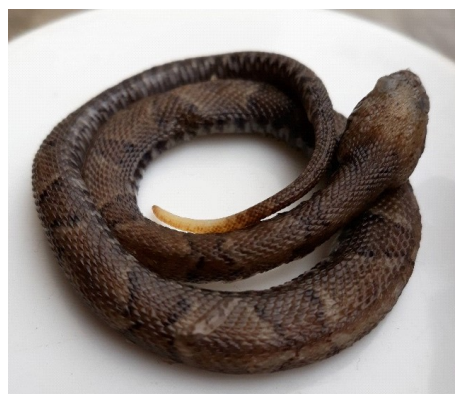
Figura 1. Ejemplar juvenil de Bothrocophias hyoprora mostrando la porción anterior del hocico elevado, típico de esta especie

Se realizó una captura casual de la víbora en unas malezas ubicadas en el Centro de Salud del distrito de Las Piedras en Madre de Dios, Perú en febrero de 2017. La