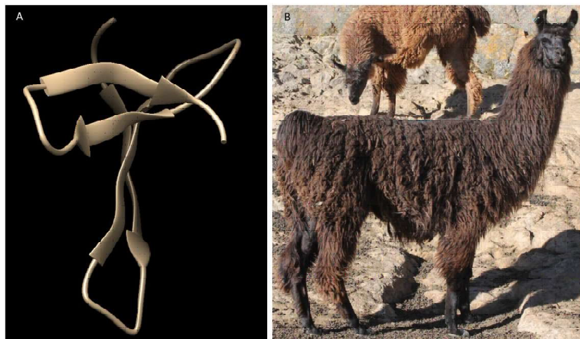
Figura 2. Composición de la isoforma corta de la proteína FGF5 (A) presente solo en las llamas Chak'u. (B). Cuando la proteína está afectada se observa un mayor crecimiento del vellón en comparación con su ancestro, el guanaco