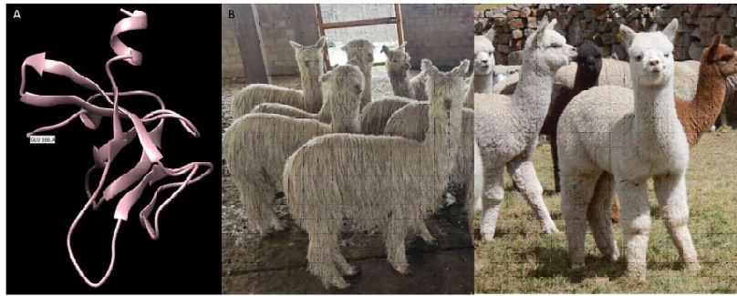
Figura 3. Composición de la isoforma corta de la proteína FGF5 (A) presente en las alpacas Suri (B) y Huacaya (C). La presencia de esta isoforma afectó el crecimiento de la fibra larga con respecto a su ancestro vicuña