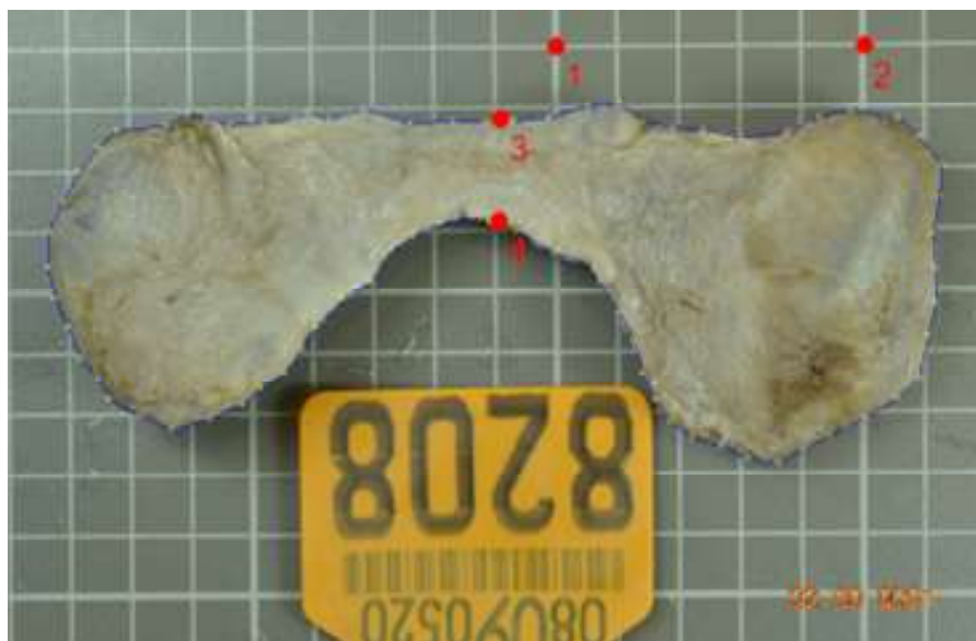
Figura 1. Visión ventral de la glándula tiroidea extraída y fijada. Se seleccionaron un conjunto de 2 landmarks de referencia sobre el istmo y 37 semilandmarks por lóbulo.